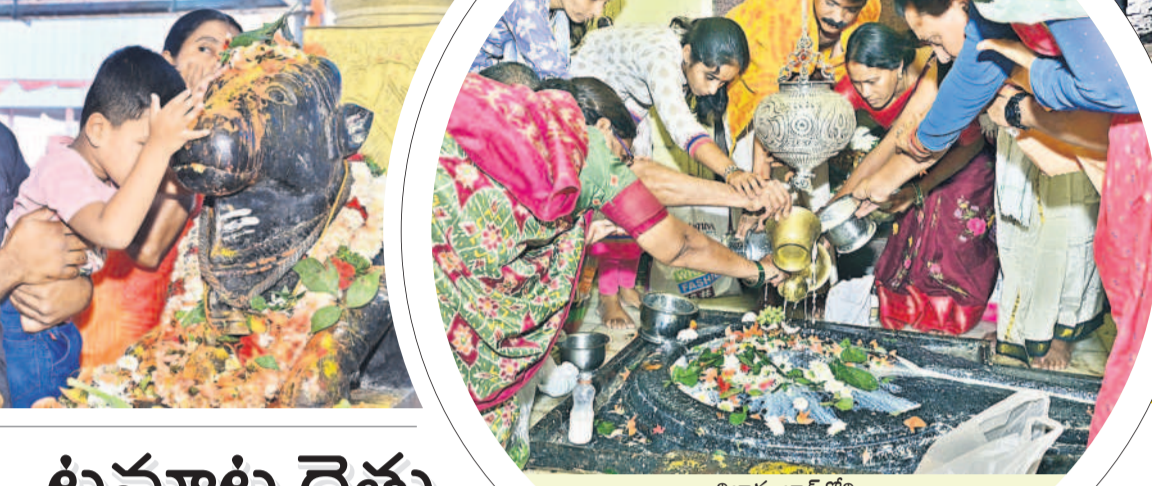
నిజామాబాద్లోని నీలకంఠేశ్వరాలయంలో లింగానికి క్షీరాబిషేకం చేస్తున్న భక్తులు