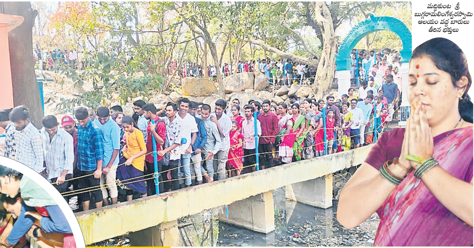
మల్లకుంట శ్రీ బుగరామలింగేశ్వరస్వామి ఆలయం వద్ద బాబులు తీలిన భక్తులు