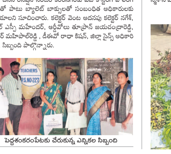
పెద్దశంకరంపేటకు చేరుకున్న ఎన్నికల సిబ్బంది