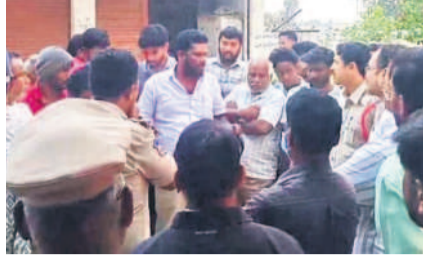
అధికారులతో గోడ వైఖరి సుకుంటున్న గ్రామస్థులు

వర్గం, ఫిబ్రవరి 26: ఇది వర్గం మండలం సామలపల్లి. కాయకాపానికి కల్పించి లేని మాటలను పట్టుకు పెట్టింది మేరు. తెలంగాణ సాధన కోసం రోడ్డు పైకెత్తాలని, మాకు ముడి గొంతు కలిపి గొంతుని గ్రామం. ఇప్పుడు త్రిబుల్ ఆర్ రోడ్డు భయంతో తమకు బుప్ప బెట్టి భూములు పోతున్నాయని వెంకటో సామలపల్లి గ్రామస్థులు బిక్కు బిక్కుంటున్నారు. రియల్ ఎస్టేట్ ఊపు మీదున్న