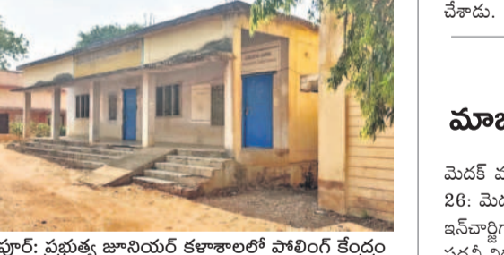
నర్సాపూర్: ప్రభుత్వ జూనియర్ కళాశాలలో పోలింగ్ కేంద్రం