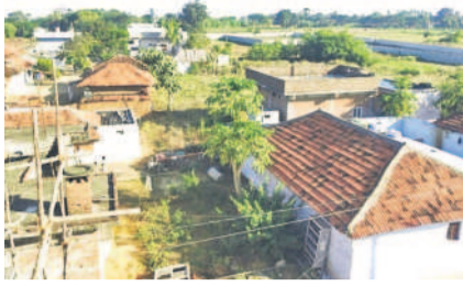
సామలపల్లి గ్రామం పూర్వ