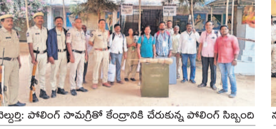
వెల్లిరై: పోలింగ్ సామగ్రితో కేంద్రానికి చేరుకున్న పోలింగ్ సిబ్బంది