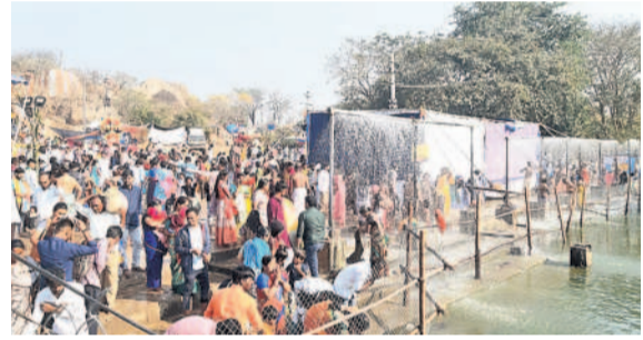
అలయం వద్ద వంద కింద పుణ్య స్నానాలు చేస్తున్న భక్తులు

పట్టు వస్తామని సర్దిబి మొక్కుతున్న మంత్రి దామోదర రాజనర్సింహ పాపన్నపేట, ఫిబ్రవరి 26: జానపదుల జాతరగా పేరుగాంచిన ఏడుపాయల జాతర బుధవారం ఘనంగా ప్రారంభమైంది. రాష్ట్ర వైద్యారోగ్యశాఖ మంత్రి దామోదర రాజనర్సింహ అమ్మవారికి పట్టు వస్తామని సమర్పించి ప్రారంభించారు. రాష్ట్ర నలుమూల నుండి కాకుండా కర్ణాటక, మహారాష్ట్ర, ఆంధ్రప్రదేశ్ నుంచి వేలాదిమంది భక్తులు ఏడుపాయలకు తరలివచ్చారు. మంజీరా నదిలో పుణ్యస్నానాలు చేసి అమ్మవారి సన్నిధిలో ఉపవాస దీక్షలు చేపట్టారు. సాయంత్రం అమ్మవారికి మొక్కులు చెల్లించుకుని దీక్షలు విరమించారు.