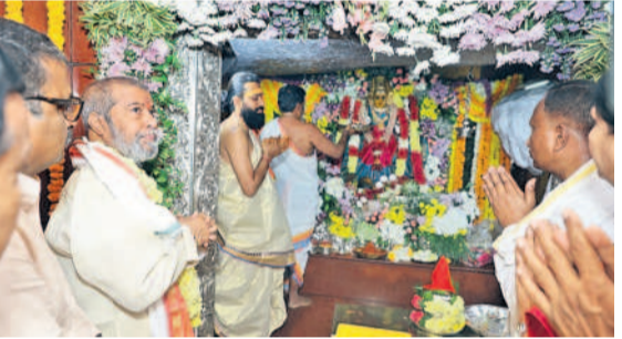
పట్టు వస్తామని సర్దిబి మొక్కుతున్న మంత్రి దామోదర రాజనర్సింహ