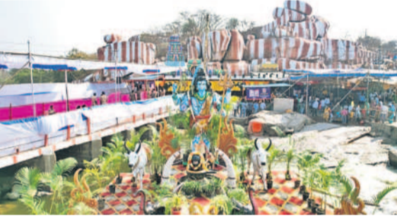
మంజీరా నదిలో తాత్కాలికంగా ఏర్పాటు చేసిన శంకరుడి విగ్రహం