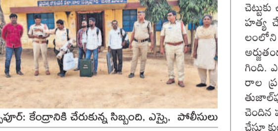
నర్సాపూర్: కేంద్రానికి చేరుకున్న సిబ్బంది, ఎస్ట్రె, పోలీసులు