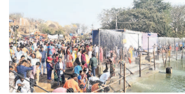
అలయం వద్ద వంద కింద పుణ్య స్నానాలు చేస్తున్న భక్తులు

పట్టు వస్తూ సర్దింపి మొక్కుతున్న మంత్రి దామోదర రాజనర్సింహ పాపన్నపేట, ఫిబ్రవరి 26: జానపదుల జాతరగా పేరుగాంచిన ఏడుపాయల జాతర బుధవారం ఘనంగా ప్రారంభమైంది. రాష్ట్ర వైద్యారోగ్యశాఖ మంత్రి దామోదర రాజనర్సింహ అమ్మవారికి పట్టు వస్తూ సమర్పించి ప్రారంభించారు. రాష్ట్ర నలుమూల నుండి కాకుండా కర్ణాటక, మహారాష్ట్ర, ఆంధ్రప్రదేశ్ నుంచి వేలాదిమంది భక్తులు ఏడుపాయలకు తరలివచ్చారు. మంజీరా నదిలో పుణ్యస్నానాలు చేసి అమ్మవారి సన్నిధిలో ఉపవాస దీక్షలు చేపట్టారు. సాయంత్రం అమ్మవారికి మొక్కులు చెల్లించుకుని దీక్షలు విరమించారు.