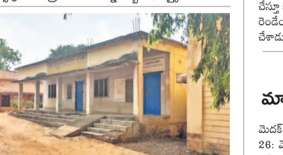
నర్సాపూర్: ప్రభుత్వ జూనియర్ కళాశాలలో పోలింగ్ కేంద్రం