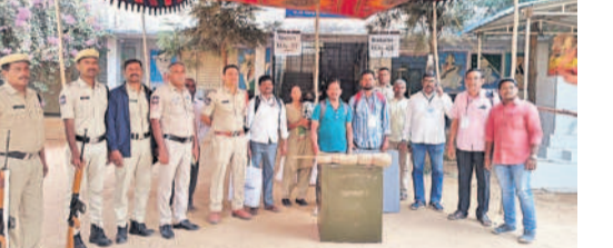
వెల్లెల్లి: పోలింగ్ సామగ్రితో కేంద్రానికి చేరుకున్న పోలింగ్ సిబ్బంది