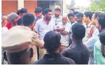
అధికారులతో గోడ వైఖరి సుకుంటున్న గ్రామస్థులు

వర్గం, ఫిబ్రవరి 26: ఇది వర్గం మండలం సామలపల్లి. కాయకాపానికి కల్పించి లేని మాటలను పట్టుకు పెట్టింది మారు. తెలంగాణ సాధన కోసం రోడ్డు పై వెళ్తున్నామని, మూకుమ్మడి గొంతు కలిపి గొంతుని గ్రామం. ఇప్పుడు త్రిబుల్ ఆర్ రోడ్డు భయంతో తమకు బుప్ప బెట్టి భూములు పోతున్నాయని వెంకటో సామలపల్లి గ్రామస్థులు బిక్కు బిక్కుమంటున్నారు. రియల్ ఎస్టేట్ ఊపు మీదున్న