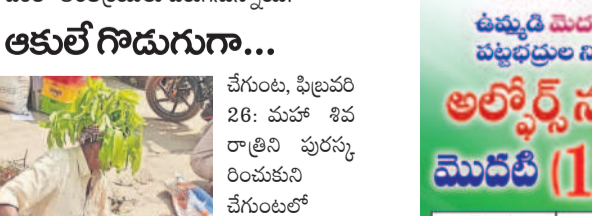
చేగుంటలో మామిడి ఆకులు, పండ్ల ఫలాలు, పువ్వులు విక్రయిస్తున్న వ్యక్తి ఎంకా తాపాన్ని కట్టుకునేందుకు ఆకులను గొడుగులా చేసి ఉపయోగం పొందుతున్నాడు.

అకులే గొడుగుగా... చేగుంట, ఫిబ్రవరి 26: మహా శివరాత్రిని పురస్కరించుకుని చేగుంటలో మామిడి ఆకులు, పండ్ల ఫలాలు, పువ్వులు విక్రయిస్తున్న వ్యక్తి ఎంకా తాపాన్ని కట్టుకునేందుకు ఆకులను గొడుగులా చేసి ఉపయోగం పొందుతున్నాడు.