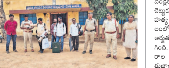
నర్సాపూర్: కేంద్రానికి చేరుకున్న సిబ్బంది, ఎస్సె, పోలీసులు