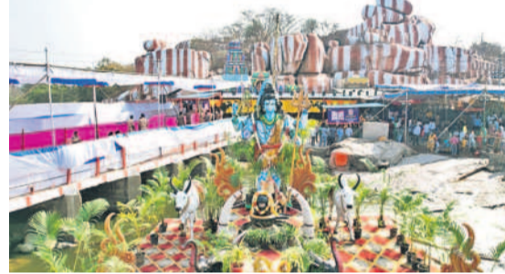
మంజీరా నదిలో తాత్కాలికంగా ఏర్పాటు చేసిన శంకరుడి విగ్రహం