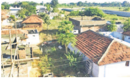
సామలపల్లి గ్రామం పూర్వ