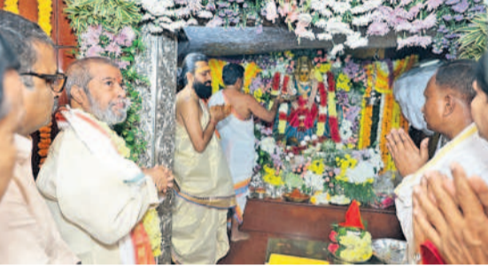
పట్టు వస్తూ సర్దింపి మొక్కుతున్న మంత్రి దామోదర రాజనర్సింహ