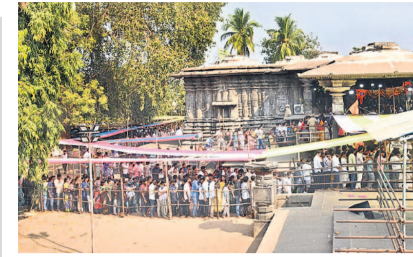
హనుమకొండలోని వేయి స్తంభాల ఆలయంలో రుద్రేశ్వరుడి దర్శనం కోసం క్యూలో బారులు తీరిన భక్తులు

ఇందులో పాల్గొన్నవారిలో ఒకరు ప్రత్యేకంగా వాల్టాప్ గ్రూప్ కి ఎడ్లబండ్ల పోలీసులను ప్రత్యేకంగా ఓ వాల్టాప్ గ్రూప్ ను ఏర్పాటు చేసుకున్నట్లు తెలిసింది. ఇందులో సభ్యులైన పాదాలనుకునే వారు కొంత నగదు చెల్లింపు చేశారని తెలుస్తున్నది. అందులో పోలీసు నిర్వహించే తేదీ, సమయం, స్థలం తదితర వివరాలను నిర్ధారించుకుంటారు. పోలీస్ గెయిస్టులను వారికి మొదటి, ద్వితీయ, తృతీయ బహుముఖులు నగదు రూపంలో అందజేస్తున్నట్లు తెలిసింది. దీంతో కొందరు యువకులు ఈ పోలీస్ పాల్గొనేందుకు ఇతర ప్రాంతాల నుంచి ప్రత్యేకంగా ఎడ్లను కొనుగోలు చేస్తున్నట్లు సమాచారం.