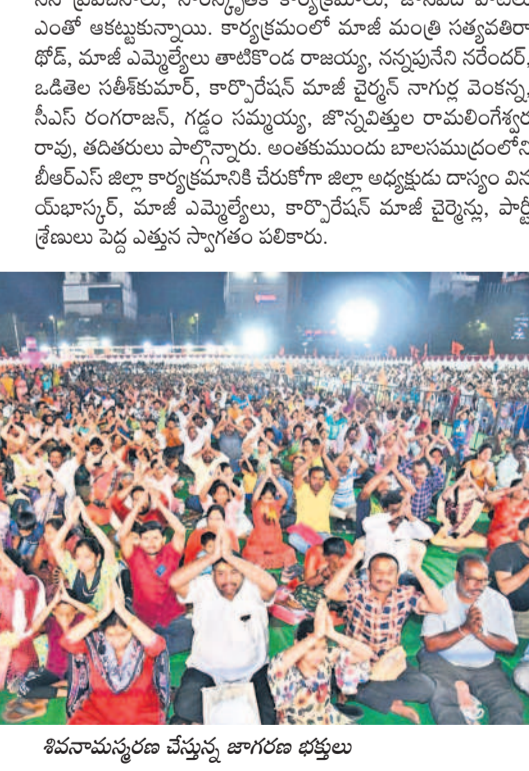
శివనామస్మరణ చేస్తున్న జాగరణ భక్తులు