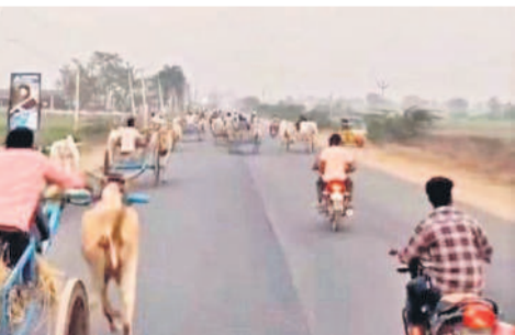
ఎల్లబండ్ల వద్ద పోలీసులను ఎడ్ల బండ్లు

హనుమకొండ సబర్బన్, ఫిబ్రవరి 26 : ఎలాంటి అనుమతులు లేకుండా ఎల్లబండ్ల మండలం కేంద్రం నుంచి మెదక్ వెళ్లే 765 డీజీ జాతీయ రహదారిపై బుధవారం తెల్లవారుజామున కొందరు వ్యక్తులు ఎడ్ల బండ్ల పండ్లు నిర్వహించడం సంబంధంగా చూసింది. ఈ విషయం పోలీసులకు కూడా తెలియకపోవడం విశేషం. 20 ఎడ్లబండ్ల ముందు ద్వితీయ వాహనాలపై ఎన్ఫోర్స్ మెంట్ యూనిట్లు అరుపులు, ఈలలు, చప్పుట్లతో వెళ్తుండడంతో ఎదురుగా వస్తున్న వాహనాదులు బెంబేలై చక్కని జరిగారు. ఈ క్రమంలో ఓ ఆటోను వేగంగా వచ్చిన ఎడ్లబండ్ల అడుపు తప్పి డీకొట్టగా డ్రైవర్ అప్రమత్తతతో ప్రమాదం తప్పింది. దీంతో దారి పొడవునా ప్రయాణికులు, వాక్స్ ఇబ్బంది పడ్డారు. అయితే రెండు పోలీస్ స్టేషన్లలోని కొందరు సిబ్బందికి ముందుగానే నిర్వాహకులు సమాచారం ఇచ్చినట్లు తెలుస్తున్నది. కాగా, ఈ పండ్ల అనుమతి లేకుండా ఎల్లబండ్లను నడిపే వ్యక్తులను పోలీసులు నిరాకరించడంతో ఎల్లబండ్ల వరకు పండ్లు నిర్వహించినట్లు తెలిసింది. ఇందులో కమలాపూర్ మండలం గుండేడు, కాసిపల్లి, దర్శనాగర్ మండలం దేవులూరు, భీమదేవరపల్లి మండలం ముల్కనూరు, కొత్తపల్లి, ఎల్లబండ్ల మండలం దండేపల్లి, హుజూరాబాద్ మండలం కందుగులకు చెందిన యువ రైతులు