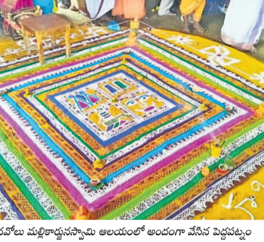
ఐనవోలు మల్లికార్జునస్వామి ఆలయంలో అందంగా వేసిన పెద్దపట్లం

ఉమ్మడి వరంగల్ జిల్లాలో వైభవంగా మహాశివరాత్రి వేడుకలు