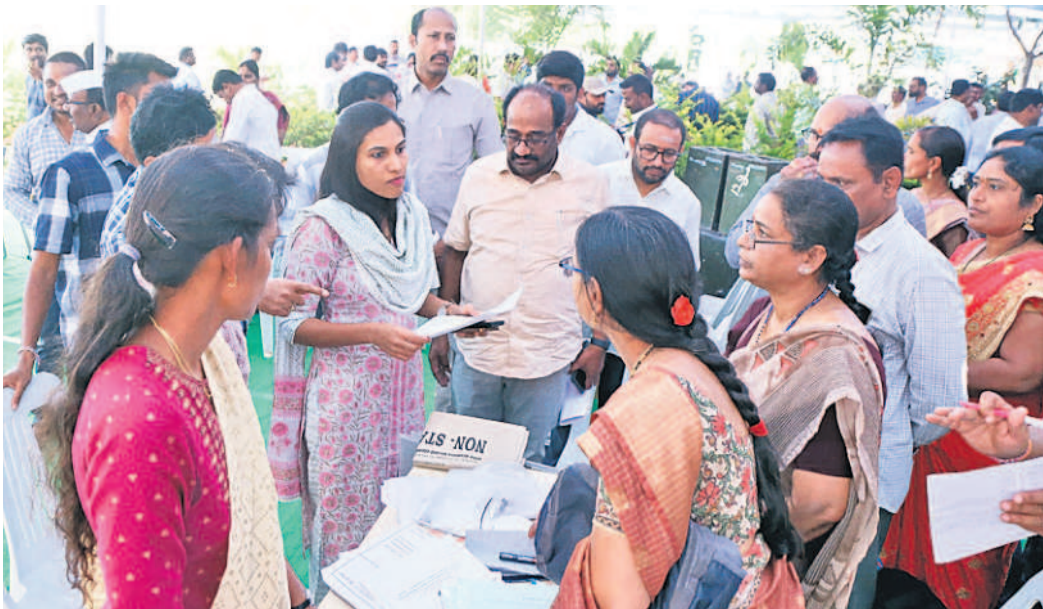
హనుమకొండ కేడీసీలో పోలింగ్ సిబ్బందికి సూచనలు చేస్తున్న కలెక్టర్ ప్రాచీణ్