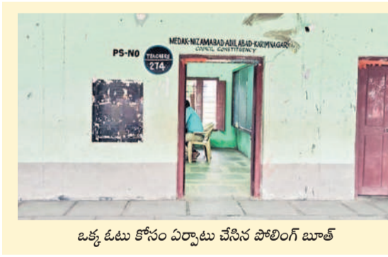
ఒక్క ఓటు కోసం ఏర్పాటు చేసిన పోలింగ్ బూత్

నేడు ఓటింగ్ వరంగల్-ఖమ్మం-నల్గొండ ఉపాధ్యక్షులు నియోజకవర్గ ఎన్నికలకు సంబంధించి గురువారం ఎన్నికల ఓటింగ్ ప్రక్రియను జరుగనున్నారు. ఉదయం 8 నుంచి సాయంత్రం 4 గంటల వరకు ఓటింగ్ కొనసాగుతుంది. ఉమ్మడి వరంగల్ జిల్లాలో 11,189 మంది ఓటర్లకు గాను 76 పోలింగ్ కేంద్రాలను ఏర్పాటు చేశారు. అన్ని పోలింగ్ కేంద్రాల్లోనూ ఇప్పటికే జిల్లా యంత్రాంగం అధ్యక్షులు ఏర్పాటు చేసి సర్దుబాటు అధికారులు తెలిపారు. అయితే హనుమకొండ జిల్లాలో 8, వరంగల్ జిల్లాలో 6, ములుగు జిల్లాలో 3 సమస్యాత్మక పోలింగ్ కేంద్రాలను గుర్తించారు. ఈ కేంద్రాల వద్ద బండ్లను ఏర్పాటు చేశారు. ఉమ్మడి జిల్లా పరిధిలో జరుగుతున్న ఎన్నికల నేపథ్యంలో ఆయా జిల్లాల కలెక్టర్లు ఇప్పటికే పలుమార్లు అధికారులతో కేంద్రాధికారుల సమావేశాలు నిర్వహించి పోలింగ్ సజావుగా జరిగేలా చర్యలు తీసుకోవాలని ఆదేశించారు.