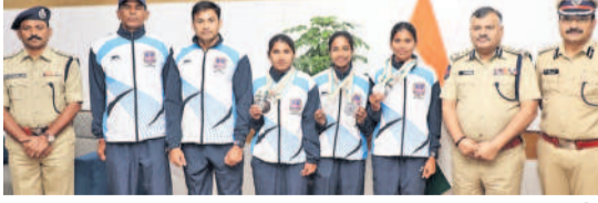
సోన్సెన్ కమిటీలో ప్రతిభనందించిన పోలీసులను అభినందిస్తున్న డీజీపీ