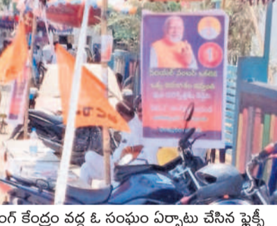
పోలింగ్ కేంద్రం వద్ద ఓ సంఘం ఏర్పాటు చేసిన ఫ్లెగ్స్