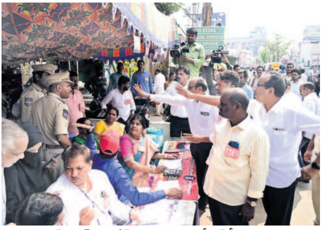
రిక్కాబజార్ స్కూల్ వద్ద కోడ్ అధికారిని పీఆర్టీయూ నాయకులపై పోలీసులకు ఫిర్యాదు చేస్తున్న యూజీపీఎస్ నాయకులు