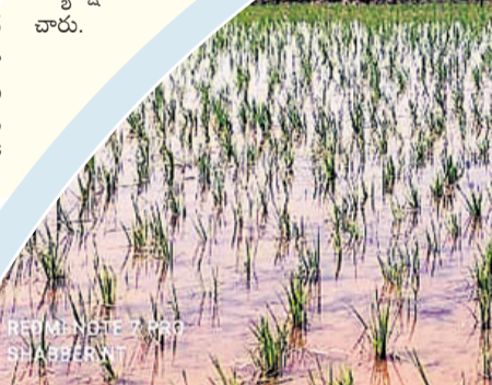
ఓసీ నీటితో వలసాట్లు వేసిన దృశ్యం