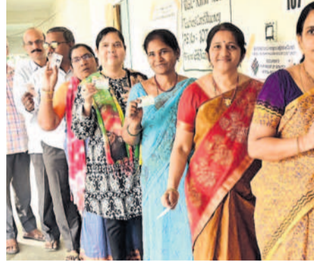
రిక్కాబజార్ స్కూల్లో ఓటు వేయడానికి క్యూలో ఉన్న టీచర్లు