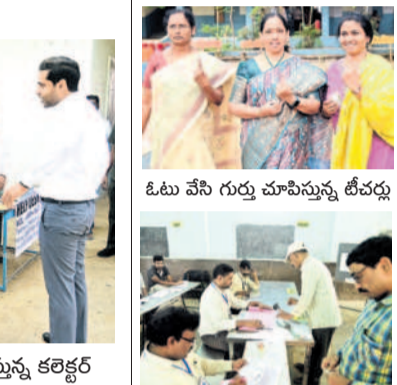
ఓటు వేసి గుర్తు చూపిస్తున్న టీచర్లు