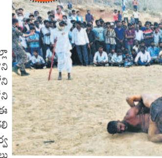
నల్లూర్పాల్ మండలం మైలారం గ్రామంలో కన్నీ పోటీల్లో తలపడుతున్న మల్లయోధులు