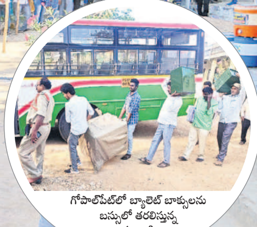
గోపాల్పేట్లో బ్యాండ్ బాళ్ళులను బస్సులో తరలిస్తున్న అధికారులు, సిబ్బంది