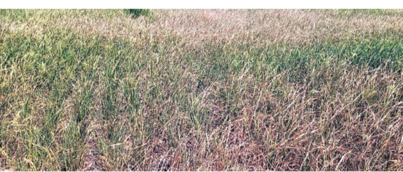
ధర్మలి మండలం దుబ్బాకలో ఎండిపోయిన వరి పంట

ఎమ్మెల్యే ఎన్నికల సందర్భంగా దివ్యాంగులు, వృద్ధులు ఇబ్బందులు ఎదుర్కోవాల్సి వచ్చింది. పోలింగ్ కేంద్రాల్లో వీల్ చైర్స్ అందుబాటులో లేక అవస్థలు వచ్చాయి. ముఖ్యంగా కరీంనగర్ పోలింగ్ కేంద్రంలో ఓటు వేయడానికి వచ్చిన రిటైర్డ్ ప్రిన్సిపాల్ నడవలేని స్థితిలో ఉండగా, వీల్ చైర్ అందుబాటులో లేకపోవడంతో అక్కడనున్న పోలీసు సిబ్బంది ఇతరులతో కలిసి చేతులతో పట్టుకుని వెళ్లి ఓటు వేయించారు. పలుచోట్ల ఇలాంటి పరిస్థితులే ఉత్పన్నమయ్యాయని సమాచారం.