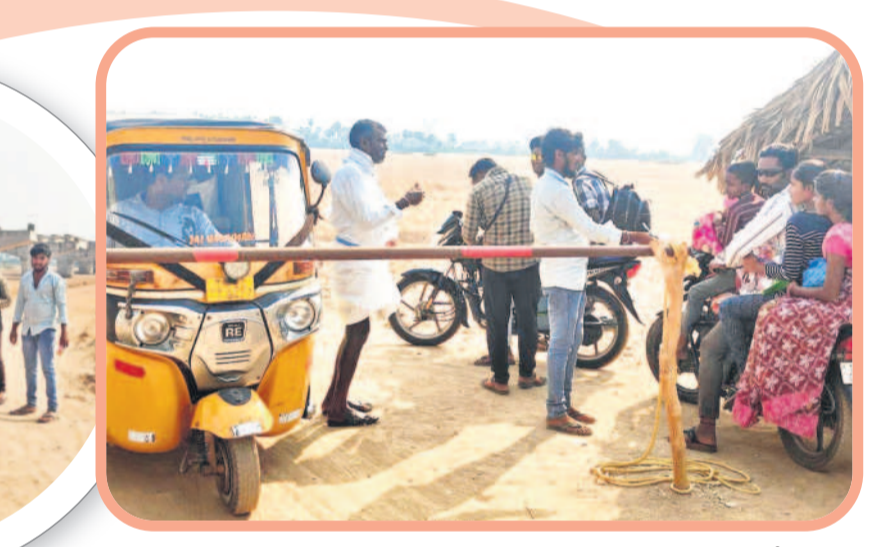
ముత్తూరం మండలం ఓడేడ్ మానేరు నదిపై అక్రమంగా మట్టి రోడ్డు నిర్మాణం గేట్ వేసి వసూళ్లు చేస్తున్న వ్యక్తులు