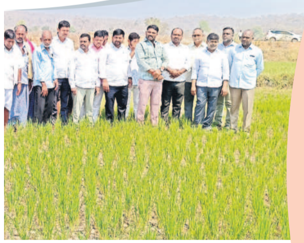
దేవునిగట్ల తండాలో ఎండిన పంటను పరిశీలిస్తున్న బీఆర్ఎస్ నిరిసిల్ల జిల్లా అధ్యక్షుడు తోట ఆగయ్య, నాయకులు