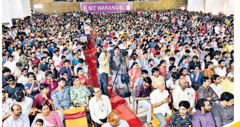
వరంగల్ నిల్లో స్ట్రాంగ్ రూమ్ వేడుకలకు హాజరైన కళాశాల విద్యార్థులు