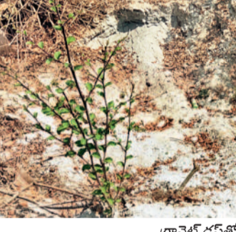
గ్రానైట్ కంపెనీళ్లు పూడ్చివేసిన పిల్ల కాలా

హనుమకొండ సబర్బన్, ఫిబ్రవరి 28 : తెలంగాణ ఉద్యమ ఉధృతిని తట్టుకోలేక అప్పటి ముఖ్యమంత్రి చంద్రబాబు నాయుడు జై 'కొంగారా' (దేవారుల) లిట్టి ఇరిగేషన్ పథకాన్ని ప్రారంభించారు. ఇది రెండు దశల నిర్మాణం పూర్తి చేసుకున్నప్పటికీ రెండవ దశల నిర్మాణం పూర్తి చేసుకోవడానికి సాగునీరు రందించలేదు. తెలంగాణ రాష్ట్రం ఏర్పాటి, సింపాగా కేసీఆర్ బాధ్యతలు చేపట్టిన తర్వాత ములుగు జిల్లా