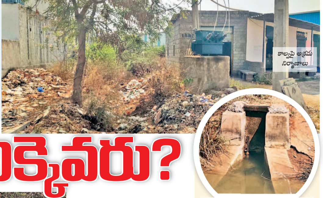
కాలాపై అక్రమ నిర్మాణాలు