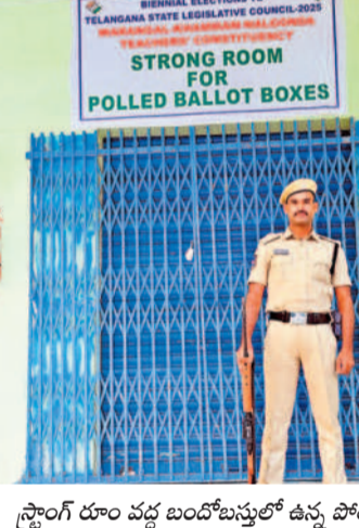
స్ట్రాంగ్ రూమ్ వద్ద బందోబస్తులో ఉన్న పోలింగ్

నల్లగొండ ప్రతినిధి, ఫిబ్రవరి 28 (నమస్తే తెలంగాణ) : అత్యంత ఉత్సాహంతో కార్యక్రమాన్ని వరంగల్-ఖమ్మం-నల్లగొండ శాసనసభ ఉపాధ్యాయ నియోజకవర్గ ఎన్నికల పోలింగ్ ముగియడంతో ఇప్పుడు అందరి అంచనాలు గెలుపొట ములపైకి మళ్లాయి. పోలింగ్ సరళిని విశ్లేషిస్తూ ప్రధాన అభ్యర్థులంతా శుభవారం జిల్లా వారిగా పరిస్థితిని సమీక్షించారు. నియోజకవర్గ వ్యాప్తంగా శుభవారం తెల్లారాజామున వెల్లడైన వివరాల ప్రకారం.. తుది పోలింగ్ 93.57 శాతంగా నమోదైంది. ఈ నెల 3వ తేదీన కొంటింగ్ జరుగుతుంది. సోమవారం మధ్యాహ్నం వరకే ఫలితాల సరళి వెల్లడికానుంది. పోలింగ్ నాటి సరళిని పరిశీలిస్తూ ప్రధాన అభ్యర్థులు ప్రాధాన్యత ఓట్ల లెక్కింపులో విజేత తెలపవచ్చని, ద్వితీయ ప్రాధాన్యత ఓట్ల లెక్కింపు తప్పనిసరి కానుందని తెలుస్తోంది. ఇక ఇదే సమయంలో ప్రధాన అభ్యర్థులు గెలుపుపై ఎవరి దీమా వారు వ్యక్తం చేస్తున్న నేపథ్యంలో ఓట్ల