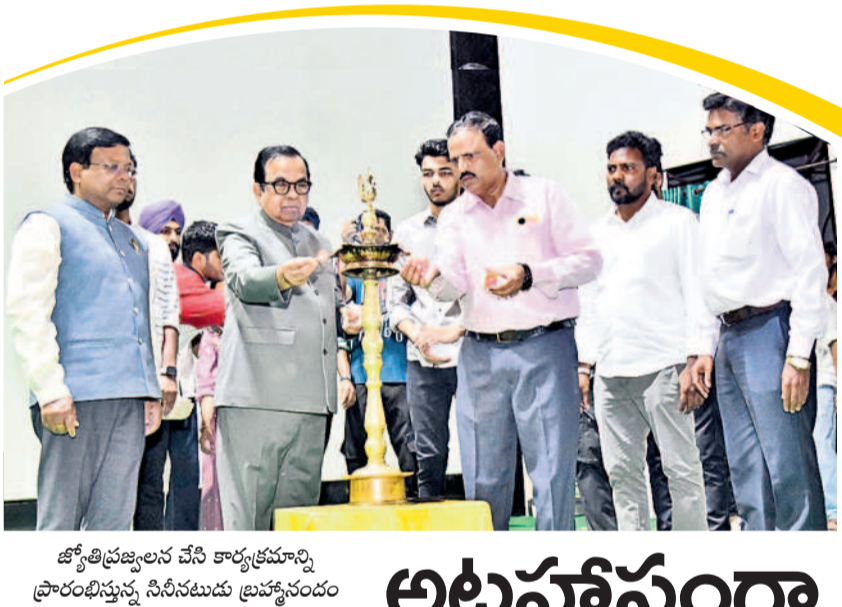
జ్యోతి ప్రజ్వలన చేసే కార్యక్రమాన్ని ప్రారంభిస్తున్న సీసీసీఎం బ్రాహ్మణసంఘం