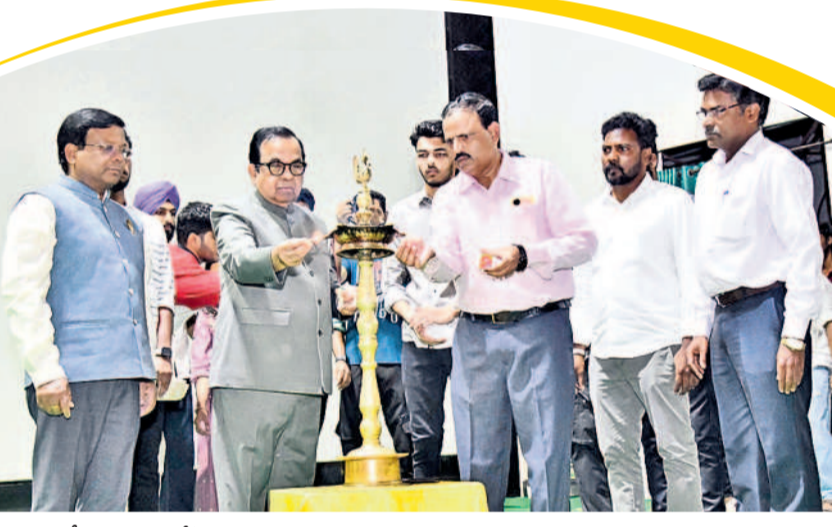
జ్యోతి ప్రజ్వలన చేసే కార్యక్రమాన్ని ప్రారంభిస్తున్న సీసీసీఎం బ్రహ్మానందం