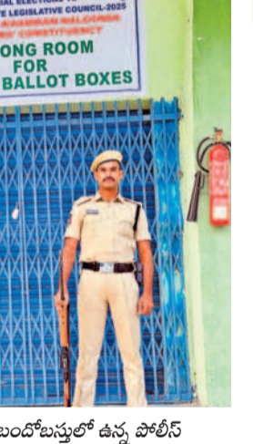
స్ట్రాంగ్ రూం వద్ద బండ్లబస్తలో ఉన్న పోలింగ్

నల్లగొండ ప్రతినిధి, ఫిబ్రవరి 28 (నమస్తే తెలంగాణ) : అత్యంత ఉత్సాహంతో రైల్వే స్టేషన్ వరంగల్-ఖమ్మం-నల్లగొండ శాసనసభ ఉపాధ్యాయ నియోజకవర్గ ఎన్నికల పోలింగ్ ముగియడంతో ఇప్పుడు అందరి అంచనాలు గెలుపొట ములపైకి మళ్లాయి. పోలింగ్ సరళిని విశ్లేషిస్తూ ప్రధాన అభ్యర్థులంతా శుభవారం జిల్లా వారిగా పరిస్థితిని సమీక్షించారు. నియోజకవర్గ వ్యాప్తంగా శుభవారం తెల్లారాజామున వెల్లడైన వివరాల ప్రకారం.. తుది పోలింగ్ 93.57 శాతంగా నమోదైంది. ఈ నెల 3వ తేదీన కొంటింగ్ జరుగుతుంది. సోమవారం మధ్యాహ్నం వరకే ఫలితాల సరళి వెల్లడికానుంది. పోలింగ్ నాటి సరళిని పరిశీలిస్తే ప్రధాన ప్రాధాన్యత ఓట్ల లెక్కింపులో విజేత తెలపవచ్చని, ద్వితీయ ప్రాధాన్యత ఓట్ల లెక్కింపు తప్పనిసరి కానుందని తెలుస్తోంది. ఇక ఇదే సమయంలో ప్రధాన అభ్యర్థులు గెలుపుపై ఎవరి దీమా వారు వ్యక్తం చేస్తున్న నేపథ్యంలో ఓట్ల