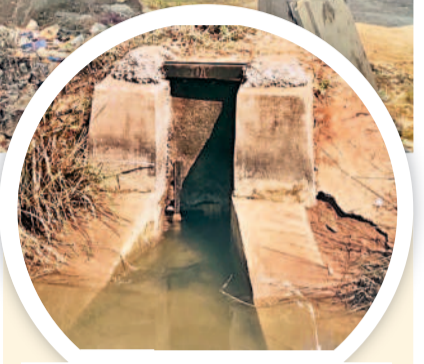
డిస్ట్రిబ్యూటర్ 7 వద్ద కానరాని పట్టణ

హనుమకొండ మండలాల్లోని 15 వేల ఎకరాలకు సాగు నీరందించేందుకు ఉత్తర కాలాను నిర్మించారు. 24 కిలోమీటర్ల వరకు ప్రధాన కాలా వ్యవస్థ దానికి 13 డిస్ట్రిబ్యూటరీలు ఏర్పాటు చేశారు. ఇందులో సగం మేరకు కాలాలు పట్టణ మరమ్మత్తులో ఉండగా, డిస్ట్రిబ్యూటర్ 7లో పట్టణం లేదు. దీంతో నీరు మొత్తం వృధాగా పోతున్నది. ప్రధాన కాలా మొత్తం సిల్ట్, ముక్కు పొదలతో మూసుకుపోయింది. సిమెంట్ ప్రక్కకు ఇష్టానుకూలంగా పోయింది. గతంలోనే ప్రధాన కాలా రిపేరుకు ప్రతిపాదనలు పంపగా ఇటీవలే రూ. 28 లక్షలు మంజూరయ్యాయి.