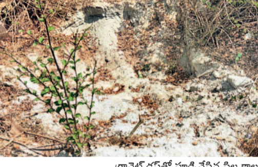
గ్రామీణ దేవారుల పూడ్చివేసిన పిల్ల కాలా

హనుమకొండ సబర్బన్, ఫిబ్రవరి 28 : తెలంగాణ ఉద్యమ ఉధృతిని తట్టుకోలేక అప్పటి ముఖ్యమంత్రి చంద్రబాబు నాయుడు జై 'కొంగారా' (దేవారులు) లోని ఇరిగేషన్ పథకాన్ని ప్రారంభించారు. జిల్లాలోని దర్భసాగర్ రిజర్వాయర్ సామర్థ్యాన్ని పెంచి ఉత్తర, దక్షిణ కాలాల్లకు నీటిని సరఫరా చేశారు. అయితే ఈ కాలాలు ఇప్పుడు లక్ష్యానికి రందించలేదు. తెలంగాణ రాష్ట్రం ఏర్పాటి, సింపాగా కేసీఆర్ బాధ్యతలు చేపట్టిన తర్వాత ములుగు జిల్లా