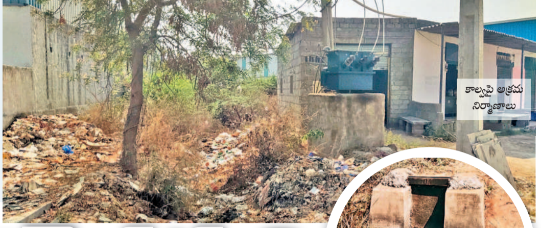
కాలాపై అక్రమ నిర్మాణాలు