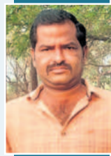
పంటలకు చేరని దేవారుల నీరు