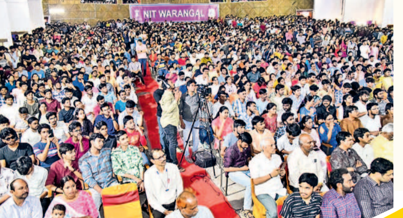
వరంగల్ నిల్లో స్ట్రీంక్ 25 వేడుకలకు హాజరైన కళాశాల విద్యార్థులు