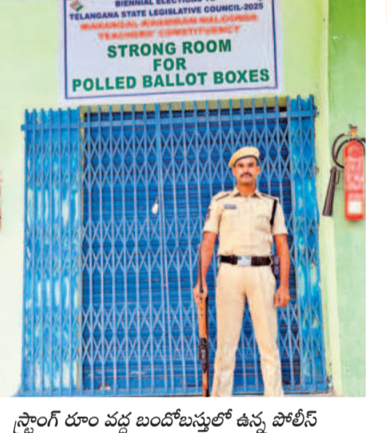
స్ట్రాంగ్ రూం వద్ద బండ్లబస్తలో ఉన్న పోలింగ్

నల్లగొండ ప్రతినిధి, ఫిబ్రవరి 28 (నమస్తే తెలంగాణ) : అత్యంత ఉత్సాహంతో కార్యక్రమాన్ని వరంగల్-ఖమ్మం-నల్లగొండ శాసనసభ ఉపాధ్యాయ నియోజకవర్గ ఎన్నికల పోలింగ్ ముగియడంతో ఇప్పుడు అందరి అంచనాలు గెలుపొట ములుపైకి మళ్లాయి. పోలింగ్ సరళిని విశ్లేషిస్తూ ప్రధాన అభ్యర్థులంతా శుభవారం జిల్లా వారిగా పరిస్థితిని సమీక్షించారు. నియోజకవర్గ వ్యాప్తంగా శుభవారం తెల్లారాజామున వెల్లడైన వివరాల ప్రకారం.. తుది పోలింగ్ 93.57 శాతంగా నమోదైంది. ఈ నెల 3వ తేదీన కొంటింగ్ జరుగుతుంది. సోమవారం మధ్యాహ్నం వరకే ఫలితాల సరళి వెల్లడికానుంది. పోలింగ్ నాటి సరళిని పరిశీలిస్తూ ప్రధాన ప్రాధాన్యత ఓట్ల లెక్కింపులో విజేత తెలపవచ్చని, ద్వితీయ ప్రాధాన్యత ఓట్ల లెక్కింపు తప్పనిసరి కానుందని తెలుస్తోంది. ఇక ఇదే సమయంలో ప్రధాన అభ్యర్థులు గెలుపుపై ఎవరి దీమా వారు వ్యక్తం చేస్తున్న నేపథ్యంలో ఓట్ల