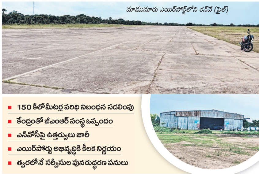
మామునూరు ఎయిర్పోర్టులోని రన్వే (ఫైల్)