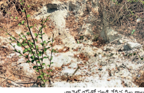
గ్రానైట్ కంపెనీల్లో పూడ్చివేసిన పిల్ల కాలనూ

హనుమకొండ సబర్బన్, ఫిబ్రవరి 28 : తెలంగాణ ఉద్యమ ఉధృతిని తట్టుకోలేక అప్పటి ముఖ్యమంత్రి చంద్రబాబు నాయుడు జై 'కొక్కా'ని (దేవారుల) లిఫ్ట్ ఇంగేషన్ పథకాన్ని ప్రారంభించారు. జిల్లాలోని దర్భుసాగర్ రిజర్వాయర్ సామర్థ్యాన్ని పెంచి ఉత్తర, దక్షిణ కాలనూల నీటిని సరఫరా చేశారు. అయితే ఈ కాలనూలు ఇప్పుడు లక్ష్యానికి రందించలేదు. తెలంగాణ రాష్ట్రం ఏర్పాటై, సింపాగా కేసీఆర్ బాధ్యతలు చేపట్టిన తర్వాత ములుగు జిల్లా