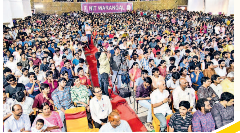
వరంగల్ నిల్లో స్ట్రాంగ్ స్ట్రీ వేడుకలకు హాజరైన కళాశాల విద్యార్థులు

భీలవరంగల్, ఫిబ్రవరి 28: అమృత్ భారత్ పథకం కింద వరంగల్ రైల్వే స్టేషన్లో అభివృద్ధి పనులు శరవేగంగా కొనసాగుతున్నాయి. స్టేషన్ అభివృద్ధి కోసం కేంద్ర రైల్వే శాఖ రూ. 25.41 కోట్లతో ఒప్పందం చేసింది. ఇందులో భాగంగా ఇప్పటికే 50 శాతం పనులు పూర్తయినట్లు దక్షిణమధ్య రైల్వే అధికారులు తెలిపారు. మిగతా పనులు త్వరలోనే పూర్తి చేస్తామని ప్రకటించారు. అమృత్ భారత్ పథకం కింద రాష్ట్ర