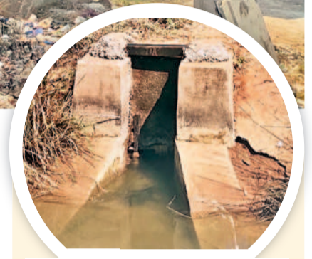
డిస్టిబ్యూటర్ 7 వద్ద కానరాని పట్టణ

హనుమకొండ మండలాల్లోని 15 వేల ఎకరాలకు సాగు నీరుందించేందుకు ఉత్తర కాలనూ నిర్మించారు. 24 కిలోమీటర్ల వరకు ప్రధాన కాలనూ వేశారు. ఇందులో సగం మేరకు కాలనూలు పట్టణ మరమ్మత్తులో ఉండగా, డిస్టిబ్యూటరీలు 7లో పట్టణం లేదు. దీంతో నీరు మొత్తం వృధాగా పోతున్నది. ప్రధాన కాలనూ మొత్తం సిల్ట్, ముక్కు పొదలతో మూసుకుపోయింది. సిమెంట్ ప్రక్కరకు ఇచ్చేరీలైన రంధ్రాలు వేశారు. గతంలోనే ప్రధాన కాలనూ రిపేరుకు ప్రతిపాదనలు పంపగా ఇటీవలే రూ. 28 లక్షలు మంజూరయ్యాయి.