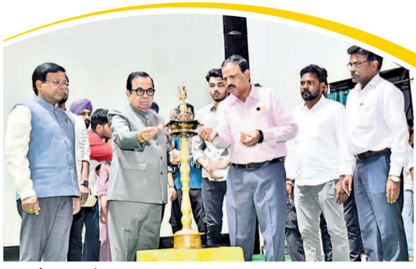
జ్యోతి ప్రజ్వలన చేసి కార్యక్రమాన్ని ప్రారంభిస్తున్న సీనియరు బ్రాహ్మణులందఱు