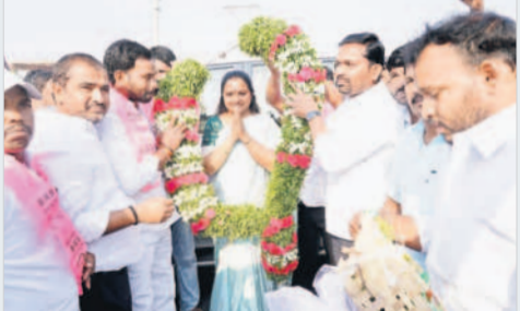
గజమాలతో ఎమ్మెల్యే కవితకు స్వాగతం పలుకుతున్న నేతలు