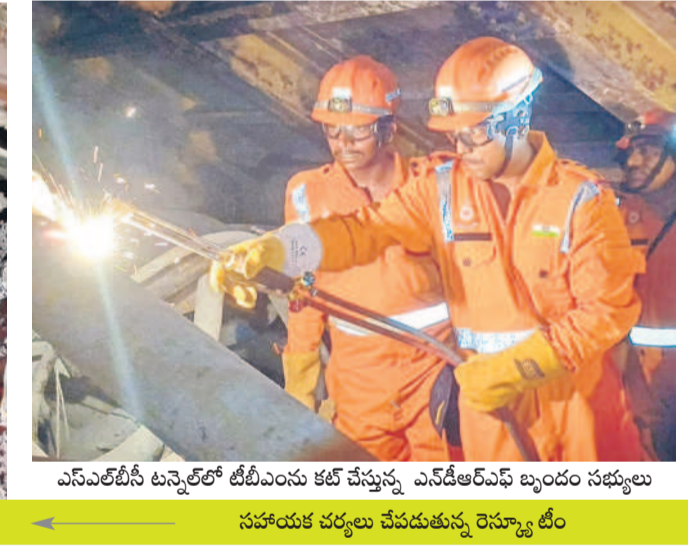
ఎన్ఎల్టీసీ టన్నెల్లో టీబీఎస్ కు చేస్తున్న ఎన్డీఆర్ఐ బృందం సభ్యులు సహాయక చర్యలు చేపడుతున్న రెస్యూ టీం

ఎన్డీఆర్ఐ ఆధ్వర్యంలో జీవీఆర్ స్పాట్లను నిర్వహించి స్పాట్లను గుర్తించడంతో శనివారం సహాయక చర్యలు పూర్తయ్యే అవకాశం ఉందని ఉన్నతాధికారులు అంటున్నారు. ప్రమాదం జరిగిన వారం రోజుల తర్వాత రం మాత్రం ఎన్డీఆర్ఐ పాల్గొన్న గుర్తిం