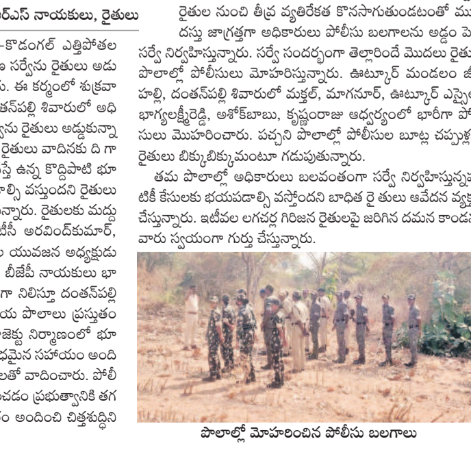
పొలాల్లో మోహరించిన పోలీసు బలగాలు