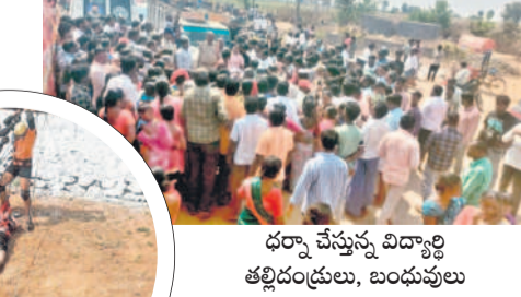
ధర్మా చేస్తున్న విద్యార్థి తల్లిదండ్రులు, బంధువులు