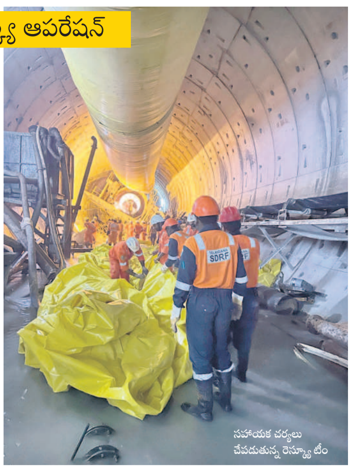
సహాయక చర్యలు చేపడుతున్న రెస్యూ టీం