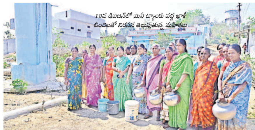
13వ డివిజన్లో మిసీ ట్యాంకు వద్ద ఖాళీ బిందెలతో నిరసన తెలుపుతున్న మహిళలు

వేసవికి ముందే ఉమ్మడి జిల్లాలోని పలు మండలాల్లో డేంజర్ టెల్స్ మోగుతున్నాయి. గ్రామాల్లో రోజురోజుకూ భూగర్భ జలాలు అడుగుంటున్నాయి. దీంతో పంట పొలాలకు సాగునీరందక ఎదుముఖం పడుతుండడంతో రైతులు అందోళన వ్యక్తంచేస్తున్నారు. సిరికొండ మండలంలోని పలు గ్రామాల్లో సాగునీరందక పంటలు ఎండిపోతున్నాయి. దీంతో రైతులు ప్రత్యామ్నాయంగా ట్యాంకర్లను ఆశ్రయిస్తున్నారు. ఒక్కరోజుకు రూ.800 వైదొలిగి ట్యాంకర్ ద్వారా పంట పొలాలకు సీక్సను అందిస్తున్నామని రైతులు గంగాధర్, గంగారెడ్డి, శ్రీనివాస్ తెలిపారు.