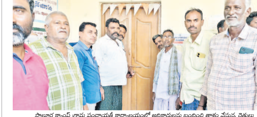
సాలూర క్యాంప్ గ్రామ పంచాయతీ కార్యాలయంలో అధికారులను బంధించి తాళం వేస్తున్న రైతులు