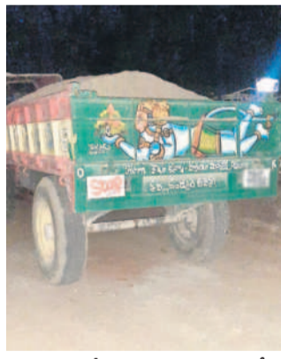
మంధరిదేవునిపల్లి గ్రామశివారులో ఇసుక ట్రాక్టర్లను పట్టుకున్న పోలీసులు