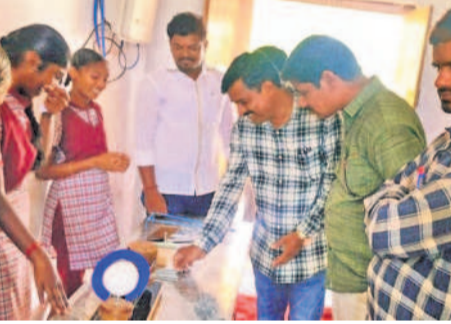
వెల్పల్లి: బండపాపాన్ పబ్లికో సైన్స్ ఎగ్జిబిషన్ను తిలకిస్తున్న ఉపాధ్యాయులు

విజ్ఞానం అనంతమైనది. ఎంత తెలుసుకున్నా ఈ విశాల ప్రపంచంలో తెలియని విషయాలు ఎన్నో ఉంటాయి. శాస్త్ర అభివృద్ధి అంతా మానవుని వైజ్ఞానిక మేధో సంపత్తి, మానవ జీవితంలో పచ్చిన ప్రతి మారు విజ్ఞాన ఫలితమే. శాస్త్ర సాంకేతిక వైపుకొని ఉపయోగించి మానవుడు కనుగొన్న అత్యధునిక సౌకర్యాన్ని మానవ మనుగడను ఎంతో సుఖవంతం చేశాయి అని విద్యార్థికులు, ఉపాధ్యాయులు తెలిపారు. జాతీయ సైన్స్ దినోత్సవం పురస్కరించుకొని శుభ్రవారం జిల్లా వ్యాప్తంగా ఆయా పాఠశాలల్లో చంద్రశేఖర్ వెంకటరామన్ జయంతి సందర్భంగా ఆయన చిత్రపటానికి పూలమాలలు వేసి, వారి సేవలు కొనియాడారు. రామన్ ఎఫ్ఎస్ కనిపెట్టిన రోజును పురస్కరించుకొని ప్రతి సంవత్సరం జాతీయ సైన్స్ దినోత్సవంగా భారత ప్రభుత్వం ప్రకటించిస్తున్న వారు తెలిపారు. సైన్స్ మేళాను ప్రదర్శించారు.