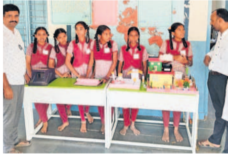
మెడక్ మున్సిపాలిటీ: పట్టణంలోని పాఠశాల విద్యార్థులను ప్రదర్శిస్తున్న ప్రదర్శనలు