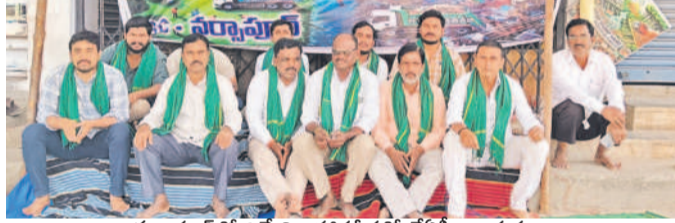
నర్సాపూర్ లో లిల్ నిరాహారదీక్షలో జేపీసీ నాయకులు

నర్సాపూర్, ఫిబ్రవరి 28: గుమ్మడిదల మండల ప్యారానగర్లో ప్రభుత్వం ఏర్పాటు చేస్తున్న డంపింగ్ యార్డుకు వ్యతిరేకంగా నర్సాపూర్ లో చేపట్టిన లిల్ నిరాహారదీక్ష శుభ్రవారం నాటికి 12వ రోజుకు చేరుకుంది. ఈ సందర్భంగా జేపీసీ నాయకులు మాట్లాడుతూ డంపింగ్ యార్డు వద్ద ప్రజలు వ్యతిరేక కిక్కుర్రా ప్రభుత్వంలో ఎలాంటి చలనం లేక