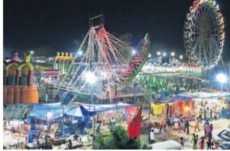
ఏడుపాయల జాతరలో భక్తులకోసం ఏర్పాటు చేసిన ఆటవస్తువులు, దుకాణాలు