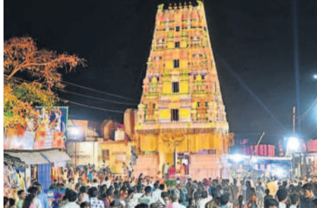
ఏడుపాయల వనదుర్గావత అలయ గోపురం