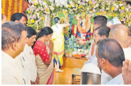
ఏడుపాయలలో అమ్మవారికి పూజ చేస్తున్న మాజీ ఎమ్మెల్యే పద్మాదేవేందర్ రెడ్డి