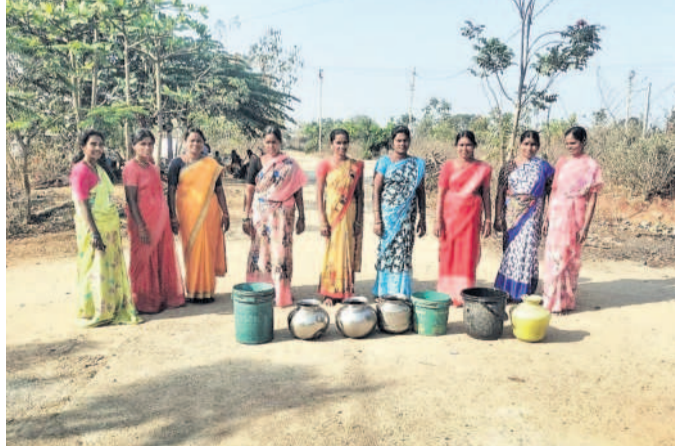
చిల్లూర్ డబుల్ బెడ్రం కాలనీలో తాగునీటి సమస్య పరిష్కారించాలని కోరుతూ రోడ్లెక్కి నిరసన తెలుపుతున్న మహిళలు

దుబ్బాక, ఫిబ్రవరి 28 : తాగునీటి సమస్య పరిష్కారించాలని కోరుతూ శుభ్రవారం సిద్దిపేట జిల్లా అగ్రికల్చరల్-భూంపల్లి మండలం చిల్లూర్ గ్రామంలోని డబుల్ బెడ్రం కాలనీ మహిళలు రోడ్లెక్కినా. కొద్దిరోజులుగా కాలనీలో తాగునీటి సరఫరా సరిగ్గా లేక నానా అవస్థలు పడుతున్నాయని మహిళలు ఆవేదన వ్యక్తం చేశారు. కాలనీలో పూర్తిగానే కలుషితం చేయబడుతున్నట్లు తెలుపారు. ఈ సమస్యపై పంచాయతీ కార్యదర్శికి లేఖలు పంపిస్తూ చిన్నపిల్లలను తాగునీటి కోసం రోడ్లెక్కినా. సంబంధిత అధికారులు స్పందించి నీటి సమస్య పరిష్కారించాలని కాలనీ మహిళలు కోరారు.