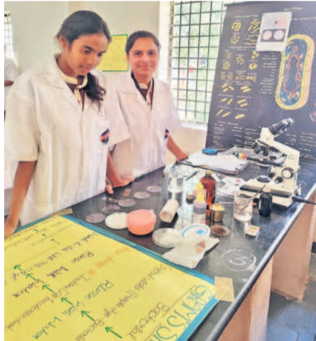
మెడక్ మున్సిపాలిటీ: మెడక్లో విద్యార్థులు ప్రదర్శనలు

ఈ సందర్భంగా విద్యార్థులు స్వయంగా తయారు చేసిన ప్రదర్శనలను అధికారులు, ఉపాధ్యాయులు తిలకించి, అభినందించారు. మాడనమ్మకాలపై మ్యాజిక్ ప్రదర్శన చేసి విద్యార్థులకు అవగాహన కల్పించారు.