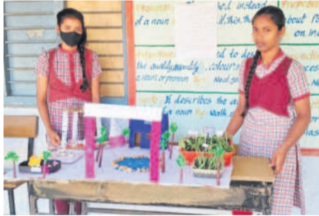
వెల్పల్లి మండలం కుకునూర్ పాఠశాలలో సైన్స్ సమావాలను ప్రదర్శిస్తున్న విద్యార్థులు