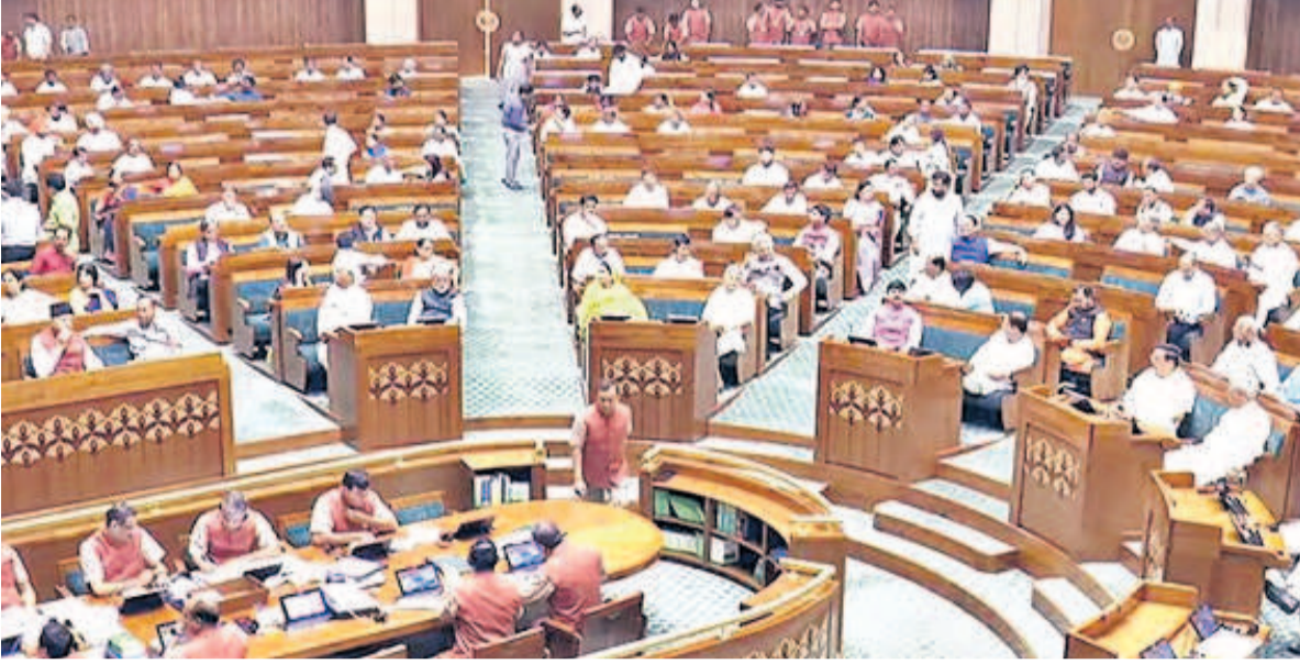
అనే కారణాన్ని మాత్రమే ప్రామాణికంగా తీసుకుంటారు.