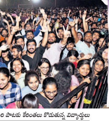
సింగర్ గీతామాధురి పాటకు కేలంతలు కొడుతున్న విద్యార్థులు

మూడో రోజు వివరి రోజైన ఆదివారం అల్లూరి-ఆకర్షణయ్యమైన ఫ్యాషన్ షో, డీజైన్డ్ డుంబుంది, సుకర్మీ నాటక(వీడి నాటిక ప్రదర్శన), ఆరోహణ-జూలియన్, సీజర్ కథన నాటక ప్రదర్శన, మైదాలకి క్విజ్-పురాణ గాథలపై పరీక్షించే ప్రశ్నా పోటీ, బిల్డింగ్ బిల్డింగ్-చేసే పోటీ నిర్వహించనున్నారు.