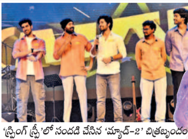
'స్ట్రాంగ్ స్ట్రీ'లో సందడి చేసిన 'మ్యూజి-2' చిత్రబృందం

మూడో రోజు వివరి రోజైన ఆదివారం అల్లూరి-ఆకర్షణయ్యమైన ఫ్యాషన్ షో, డీజైన్డ్ డుంబుంది, సుకర్మీ నాటక(వీడి నాటిక ప్రదర్శన), ఆరోహణ-జూలియన్, సీజర్ కథన నాటక ప్రదర్శన, మైదాలకి క్విజ్-పురాణ గాథలపై పరీక్షించే ప్రశ్నా పోటీ, బిల్డింగ్ బిల్డింగ్-చేసే పోటీ నిర్వహించనున్నారు.