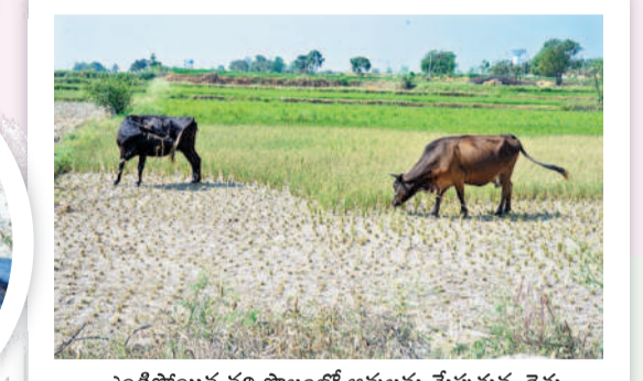
ఎండిపోయిన వరి పొలంలో ఆవులను మేపుతున్న రైతు