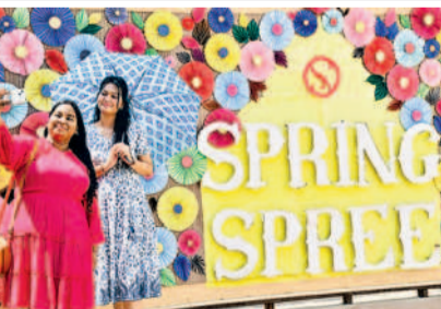
నటిలోని 'స్ట్రాంగ్ స్ట్రీ' బోర్డు వద్ద సీట్ల దిగుతున్న విద్యార్థినులు

పాటు ఇతర అధికారులతో ఫోన్లో పలుమార్లు మాట్లాడారు. శాశ్వతంగా పాటు దేవరపల్లెల మండలంలోని పలు తండాల్లో బిఆర్ఎస్ శ్రేణులతో కలిసి పర్యటించిన ఆయన.. వెంటనే నీళ్లు పడలకోపోయారు. తాను అధికారంలో దేవూరు-4 ఎల్ ద్వారా గోదావరి జలాలను విడుదల చేశారు. రైతుల బాధలను చూసి గోదావరి జలాలను విడుదల చేసే రాష్ట్ర ప్రభుత్వానికి, దేవూరు నీటి పారుదల శాఖ అధికారులకు ఎర్రబెల్లి ధన్యవాదాలు తెలిపారు.