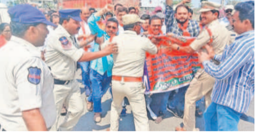
కలెక్టరేట్లోకి వెళ్లిన నాయకులను అడ్డుకుంటున్న పోలీసులు

ఖమ్మం కలెక్టరేట్ ముట్టడిలో సీపీఎం నాయకులు