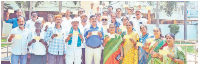
ఖమ్మంలోని అమరవీరుల స్తూపం వద్ద పోస్టుకార్డులు చూపిస్తున్న తెలంగాణ ఉద్యమకారులు