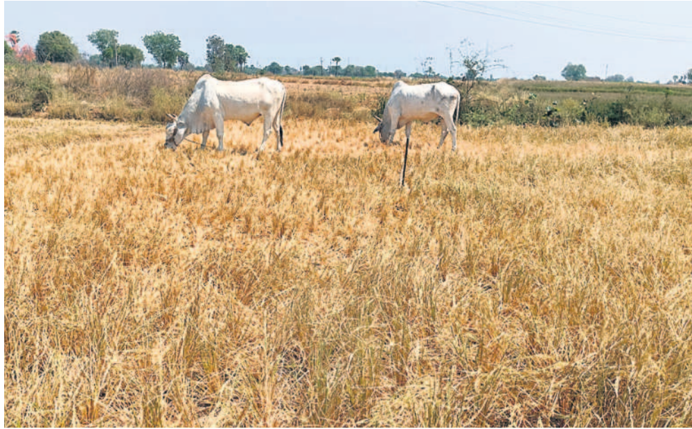
జనగామ జిల్లా దేవరపల్లెల మండలంలో సాగునీరు లేకపోవడంతో పాలం ఎండిపోయింది. దీంతో అప్పు తెచ్చి పెట్టిన పెట్టుబడి కూడా వచ్చే పరిస్థితి లేకపోవడంతో తీవ్ర ఆవేదనకు గురైన రైతుల పొలాన్ని పశువుల మేతకు వదిలేశారు.