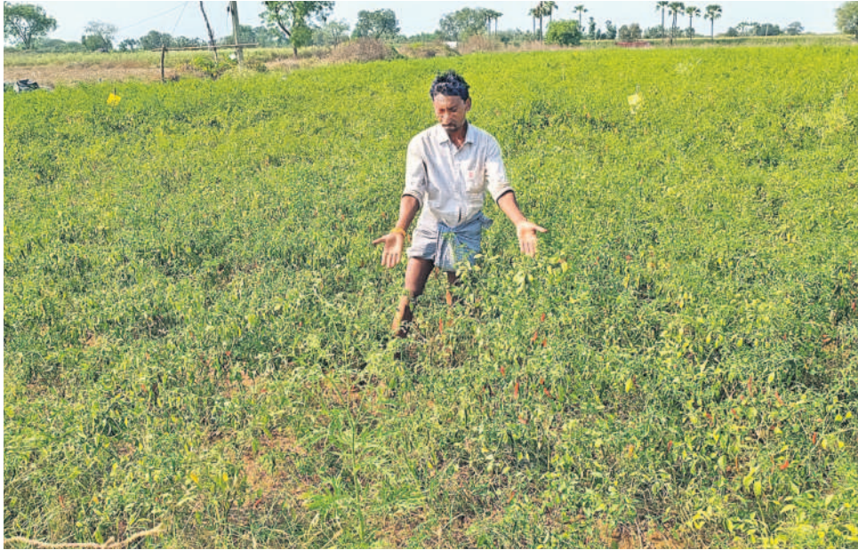
మహబూబాబాద్ జిల్లా నర్సంపాలపేట మండలంలో వేతికొచ్చే దశలో ఉన్న మీరడు పంట సీతల లేక ఎండిపోతుండటంతో రైతు బోరుగు ఏడ్చాడు. తన పంటను చూపిస్తూ తీవ్ర బావోద్వేగానికి గురయ్యాడు. పెట్టుబడి వచ్చే పరిస్థితి లేదని వేరొన్నాడు.