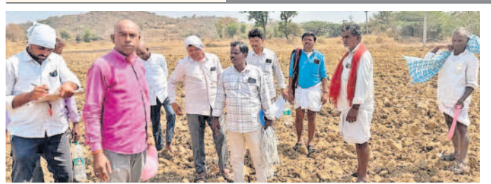
నారాయణపేట జిల్లా కేంద్రంలో కొండంగల్ ఎత్తిపోతల సర్వే పనులను అధ్యక్షులు సమీక్షించారు

న్యూఢిల్లీ, మార్చి 3: ప్రభుత్వ రంగ సంస్థలైన ఐఆర్సీటీసీ, ఐఆర్ఎస్ఎస్ఎల్కు నవరత్న హోదాను కల్పిస్తూ కేంద్ర ప్రభుత్వం నిర్ణయం తీసుకున్నది. దీంతో నవరత్న హోదా కలిగిన సంస్థల సంఖ్య 26కి చేరుకున్నాయి. ఆయా సంస్థల ఆర్థిక స్థితిగతులు, ఆదాయ-లాభాల అర్హత ఆధారంగా కేంద్రం నవరత్న హోదాను ఇస్తున్నది. దీంతోపాటు గంగా 2023-24 ఆర్థిక సంవత్సరానికి ఐఆర్సీటీసీ రూ.4,270 కోట్ల వార్షిక ఆదాయాన్ని, ఐఆర్ఎస్ఎస్ఎల్ రూ.28,644 కోట్ల ఆదాయాన్ని గడించాయి. ఈ రెండు సంస్థలకు కేంద్ర మంత్రి ఆర్జున్ వైష్ణవ శుభాకాంక్షలు తెలియజేశారు. నవరత్న హోదా కలిగిన పీఎస్ఎస్ఎల్ పెట్టుబడులు, నిర్వహణ నిర్ణయం తీసుకునే అవకాశం ఉంటుంది. కంపెనీ నికర విలువలో 15 శాతం లేదా రూ.1,000 కోట్ల వరకు పెట్టుబడి ప్రతిపాదనకు కేంద్ర ప్రభుత్వం అనుమతి తీసుకోవాల్సిన అవసరం ఉండదు.