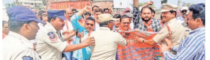
ఇండ్ల స్థలాల గుంజుకోవడంపై కలెక్టర్ ముట్టడి

లోడింగ్లో దళారులకు రూపాయలు 4600 ఇవ్వాలి. యాద్వీ లాల్ టిప్పర్ అసోసియేషన్ నిరసన పెద్దపల్లి, మార్చి 3(నమస్తే తెలంగాణ): బూడిద లోడింగ్ను ఎన్టీపీసీనే చేపట్టాలని, ఒక్కో టిప్పర్కు రూ. 4600 వసూలు చేస్తున్న దళారుల నుంచి విముక్తి కల్పించాలని లాల్, టిప్పర్ ఓనర్లు, డ్రైవర్లు, క్లీనర్లు మొదలైనవారు సూచించారు. యాద్వీ లాల్ టిప్పర్ అసోసియేషన్ అంతర్జాతీయ మండలం మల్కాపల్లి గేట్ వద్ద యాద్వీ టిప్పర్ లాల్ అసోసియేషన్ ఆధ్వర్యంలో బూడిద లాల్ రవాణాను నిలిపివేసి ఎన్టీపీసీ