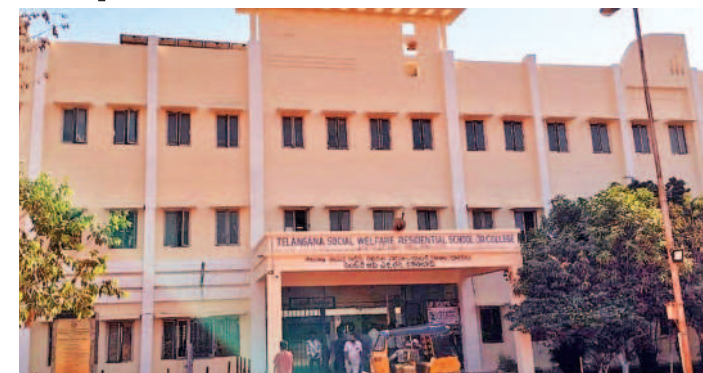
వికారాబాద్ జిల్లా కేంద్రంలోని కొత్తగడి గురుకుల పాఠశాల

వికారాబాద్, మార్చి 3: టీచర్ వేదింపులు భరించలేక 10వ తరగతి విద్యార్థిని ఆత్మహత్యాయత్నం చేసిన ఘటన వికారాబాద్ జిల్లా కేంద్రంలో ఆలస్యంగా వెలుగులోకి వచ్చింది. కొత్తగడి గురుకుల పాఠశాలలో ప్రవేశం తీసుకున్న 10వ తరగతి విద్యార్థిని ఆత్మహత్యాయత్నం చేసిన ఘటన వికారాబాద్ జిల్లా కేంద్రంలో ఆలస్యంగా వెలుగులోకి వచ్చింది. కొత్తగడి గురుకుల పాఠశాలలో ప్రవేశం తీసుకున్న 10వ తరగతి విద్యార్థిని ఆత్మహత్యాయత్నం చేసిన ఘటన వికారాబాద్ జిల్లా కేంద్రంలో ఆలస్యంగా వెలుగులోకి వచ్చింది.