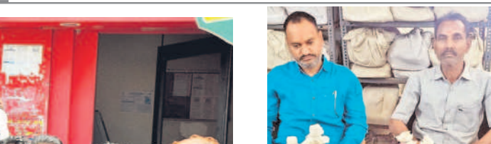
హన్సిటికి చిక్కిన సబ్ రిజిస్ట్రార్

ఖమ్మం, మార్చి 3: ఎన్నికలకు ముందు ఉద్యమకారులకు ఇచ్చిన హామీలు అమలు చేయాలని పోలీసులపై పోస్టుకార్డు ఉద్యమకారులు ఘోరం రాష్ట్ర కమిటీ పిలుపు మేరకు జిల్లా ఇసుక వెళ్లిన కాంగ్రెస్ నాయకులు దాడికి యత్నించారు. కానిస్టేబుల్ వేర్కొన్నారు.