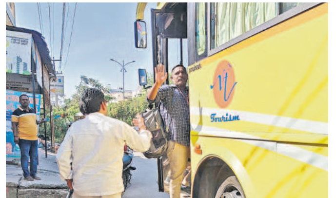
నిజామాబాద్ జిల్లా కేంద్రంలో బస్సుల్లో ఎక్కి కుటుంబసభ్యులకు వీడ్కోలు పలుకుతున్న బాబు