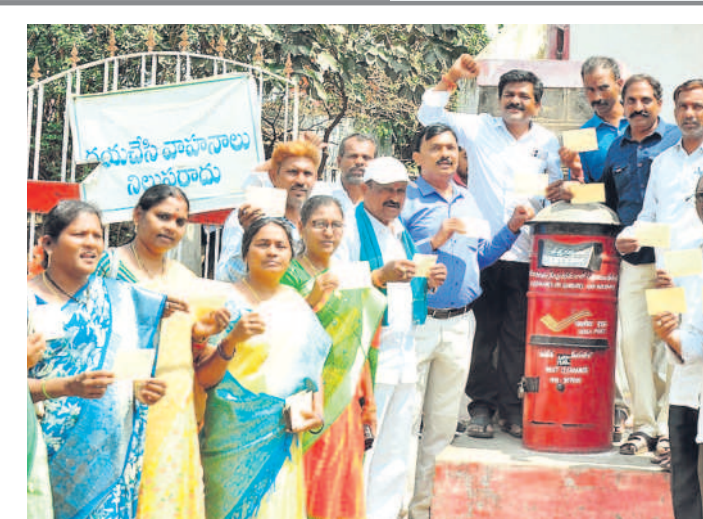
ఖమ్మం నగరంలోని అమరవీరుల స్థూపం వద్ద పోస్టుకార్డు ఉద్యమం చేపట్టిన ఉద్యమకారులు