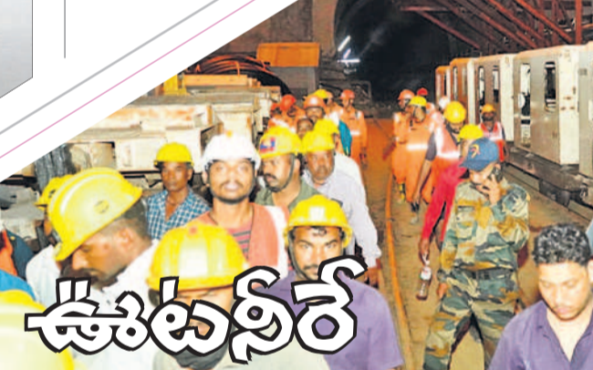
టన్నెల్ లోంచి బయటకు వస్తున్న రెస్కూర్స్ బృందాలు

● 5 నుంచి 13 వరకు రోజుకు 4 వేల క్యూసెక్కులు టీటీ డ్యాం నుంచి ఈనెల 5 నుంచి ఆర్డీఎస్ తోపాటు కేసీ కెనాల్ ఇండెంట్ను జాయింట్గా విడుదల చేసేందుకు ఇంగ్లీషన్ అధికారులు చర్యలు చేపట్టారు. ఆర్డీఎస్ టీఎంసీ, కేసీ కెనాల్ కు 1.8 టీఎంసీలు 13వ తేదీ వరకు రోజుకు 4 వేల క్యూసెక్కులు విడుదల చేసేందుకు తెలంగాణ, ఏపీ రాష్ట్రాల ఇంగ్లీషన్ ఈఎన్ఎస్ఎల్ టీటీ బోర్డుకు లేఖలు రాశారు. విడుదలైన నీరు తుంగభద్రా డ్యాం నుంచి ఆర్డీఎస్ ఆనకట్టకు 8 లేదా 9వ ఆనకట్టకు చేరే అవకాశం ఉన్నదని అధికారులు అంచనా వేస్తున్నారు. ఆనకట్టకు సకాలంలో నీరు చేరేటే పంటలు ఎండవని, ఆ దిశగా అధికారులు చొరవ తీసుకోవాలని ఆయకట్టు రైతులు కోరుతున్నారు.