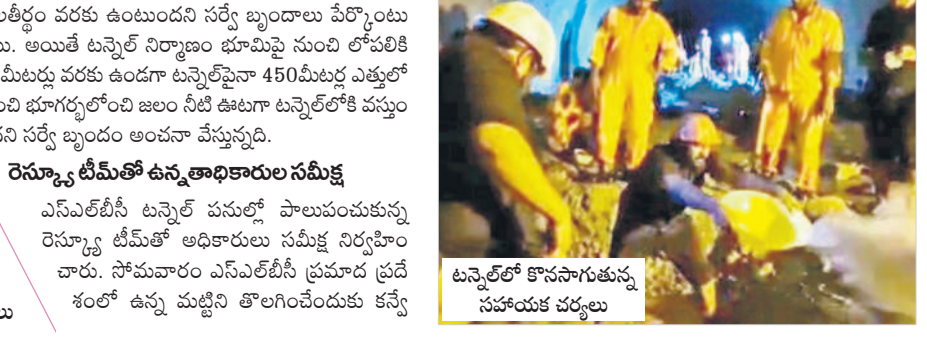
టన్నెల్ లో కొనసాగుతున్న సహాయక చర్యలు