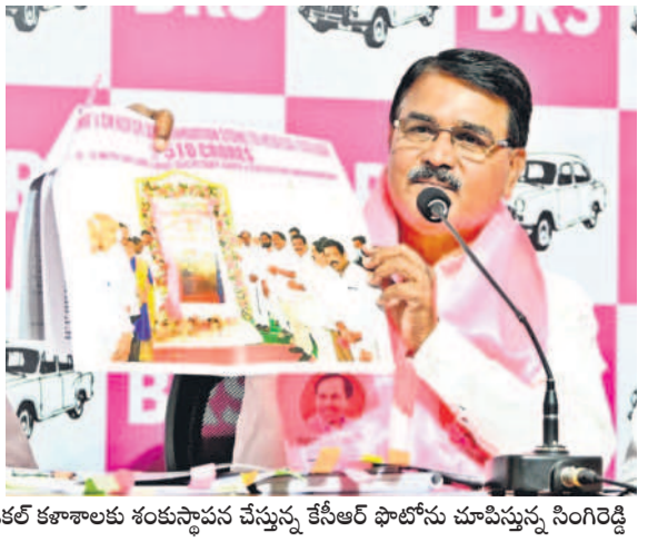
మెడికల్ కళాశాలకు శంకుస్థాపన చేస్తున్న కేసీఆర్ ఫోటోను చూపిస్తున్న సింగిరెడ్డి