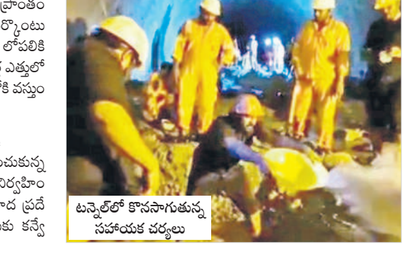
టన్నెల్ లో కొనసాగుతున్న సహాయక చర్యలు