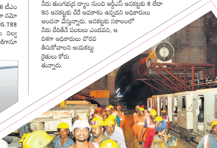
టన్నెల్ లోంచి బయటకు వస్తున్న రెస్కూర్ బృందాలు

● 5 నుంచి 13 వరకు రోజుకు 4 వేల క్యూసెక్కులు టీటీ డ్యాం నుంచి ఈనెల 5 నుంచి ఆర్డీఎస్ తోపాటు కేసీ కెనాల్ ఇండెంట్ ను జాయింట్ గా విడుదల చేసేందుకు ఇంగ్లీషు అధికారులు చర్యలు చేపట్టారు. ఆర్డీఎస్ టీఎంసీ, కేసీ కెనాల్ కు 1.6 టీఎంసీలు 13వ తేదీ వరకు రోజుకు 4 వేల క్యూసెక్కులు విడుదల చేసేందుకు తెలంగాణ, ఏపీ రాష్ట్రాల ఇంగ్లీషు అధికారులు టీటీ బోర్డుకు లెఖలు రాశారు. విడుదలైన నీరు తుంగభద్ర డ్యాం నుంచి ఆర్డీఎస్ అనకట్టుకు 8 లేదా 9వ అనకట్టుకు చేరే అవకాశం ఉన్నదని అధికారులు అంచనా వేస్తున్నారు. అనకట్టుకు సకాలంలో నీరు చేరేటే పంటలు ఎండవని, ఆ దిశగా అధికారులు చొరవ తీసుకోవాలని ఆయకట్టు రైతులు కోరుతున్నారు.