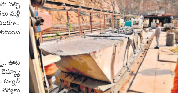
టన్నెల్ లోంచి బయటకు తీసుకువస్తున్న దృశ్యం