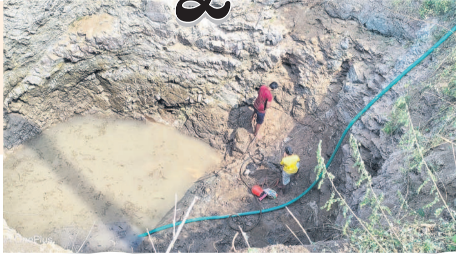
నీరు లేక అడుగంటిన వ్యవసాయ బావి

వెల్గూర్, మార్చి 8 : గోలపల్లి మండలం రంగధామనుపల్లి వద్ద ప్రారంభమయ్యే ఎస్ఆర్ఎస్పీ డీ 83/ఏ కాలువ ద్వారా వారబండ్ లెక్కన నీటిని విడుదల చేసామని ప్రభుత్వం ప్రకటించడంతో రైతులు సంతోష పడ్డారు. కాలువ పరివాహక ప్రాంతంలో భూగర్భ జలాలు పెరుగుతాయని, బావుల కింద డైర్యాంగా వరి సాగు చేసుకున్నారు. కానీ, పేరుకే వారబండ్ అయింది. రంగధామనుపల్లి చెరువు నిండిన తర్వాత అక్కడి నుంచి సుమారు 15 కిలో మీటర్ల దూరంలో ఉన్న ఎండపల్లికి నీళ్లు రావాల్సి ఉంటుంది. అయితే, చెరువు నిండినా కాలువ చెత్తా చెదారం, పిప్పిమొక్కలు, పూడిక పేరుకుపోవడంతో ఇక్కడి వరకు రావడం గగనమే అయింది. ఇక ఎండపల్లి నుంచి సుమారు 5 కిలోమీటర్ల దూరంలో ఉన్న అంబారీపేట వరకు కాలువ ఉన్నా అక్కడి రైతులు ఆశలు వదులుకున్నారు. ఎండపల్లి, అంబారీపేట వరకు కనీసం ఒక్కసారి కూడా సాగునీరు రాకపోవడంతో కాలువలు, బావుల కింద పంటలు ఎండిపోవడంతో ఆందోళన చెందుతున్నారు. ఎండపల్లి మండల కేంద్రంలో సుమారు 520 ఎకరాల్లో 150 మంది రైతులు వరి సాగు చేయగా, నీళ్లు ఇప్పటి వరకు సుమారు 25 మంది రైతులకు చెందిన 55 నుంచి 60 ఎకరాలలో పంట ఎండిపోయింది. పరిస్థితి ఇలాగే ఉంటే పంట పండకరాలు సైతం ఎండి ప్రమాదమున్నది. ఈ విషయం అధికారులకు తెలిపినా ఫలితం లేకపోవడంతో ఏం చేయాలో పాలు పోక రైతులు తమ పంట పొలాల్లో పశువులను మేపుతున్నారు. భూమి కొలుకు తీసుకుని సాగు చేసిన రైతులు కంటతడి పెడుతున్నారు. గడిచిన పదేండ్లలో ఏనాడూ సాగు నీళ్లు ఇబ్బంది పడలేదని కేసీఆర్ పాలనను గుర్తు చేసుకున్నారు. పంటలు ఎండుతున్న విషయాన్ని ఎస్సార్సీపీ డీఈఈ రమేష్ సోనితో సంప్రదించి ప్రయత్నం చేయగా, ఆయన సహాయం దాటవేయడం గమనార్హం.