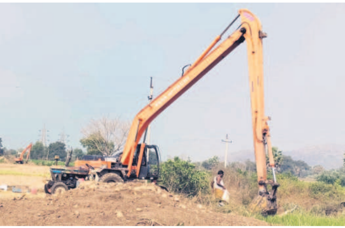
ఎండపల్లి మండల కేంద్రంలో పొలాలను కాపాడుకునేందుకు భారీ పొకెయిన్లతో పూడిక తీయిస్తున్న రైతు