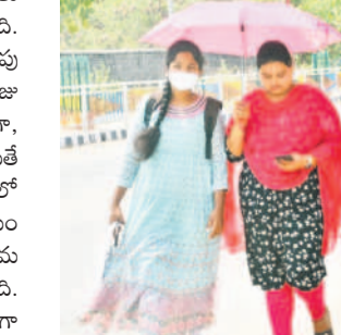
కరీంనగర్లో గోడగురు పట్టుకొని వెళ్తున్న యువతలు

కోటిసీట్, మార్చి 8 : ఎండ తీవ్రత పెరుగుతున్నది. మార్చి ఆరంభంలోనే దంచికొడుతున్నది. ఉదయం తొమ్మిది గంటల నుంచే ప్రజాపం చూపుతున్నది. మధ్యాహ్నం కూడా భోగమంటున్నది. రోజు రోజుకూ పగటి ఉష్ణోగ్రతలు పెరుగుతుండగా, పొద్దుంకా మండిపోతున్నది. రామగుండం అయితే నిస్పృల కొలిమిలా మారుతున్నది. ప్రతి వేసవిలో ఇక్కడ రికార్డు స్థాయి ఉష్ణోగ్రతలు నమోదవుతుండగా, ప్రస్తుతం అదే పరిస్థితి కనిపిస్తున్నది. సోమవారం గరిష్టంగా 37.4 డిగ్రీలు రికార్డుయింది. ఇప్పుడే ఇలా ఉంటే ఏప్రిల్లో ఎంత తీవ్రంగా ఉంటుందోనే ఆందోళన వ్యక్తమవుతున్నది. కాగా, ఎండలు దంచి కొడుతుండడంతో మధ్యాహ్నం వేళ రోడ్డు నిర్మాణవ్యూహం మారుతున్నాయి. ఇక ఇక్కడ మూలన పడ్డ కూలర్ల మళ్లీ తీరుగుతున్నాయి.