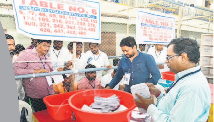
కరీంనగర్లోని అంబేద్కర్ ఇండోర్ స్టేడియంలో ఎమ్మెల్సీ ఓట్ల లెక్కింపు చేస్తున్న సిబ్బంది