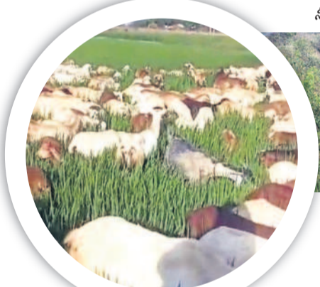
పొలంలో గొర్రెలను మేపుతున్న రైతులు