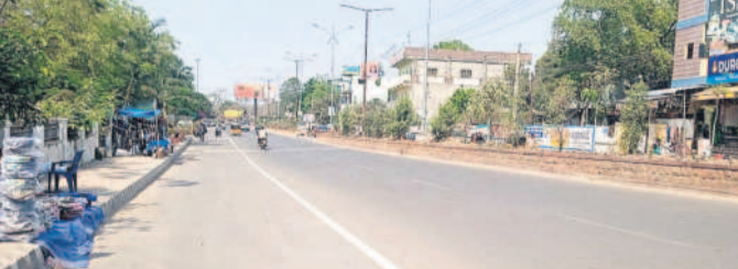
సోమవారం గోదావరిఖానలో ఎండ తీవ్రతకు నిర్మాణవ్యూహంగా మాండ ప్రధాన రహదారి

కోటిసీట్, మార్చి 8 : ఎండ తీవ్రత పెరుగుతున్నది. మార్చి ఆరంభంలోనే దంచికొడుతున్నది. ఉదయం తొమ్మిది గంటల నుంచే ప్రజాపం చూపుతున్నది. మధ్యాహ్నం కూడా భోగమంటున్నది. రోజు రోజుకూ పగటి ఉష్ణోగ్రతలు పెరుగుతుండగా, పొద్దుంకా మండిపోతున్నది. రామగుండం అయితే నిస్పృల కొలిమిలా మారుతున్నది. ప్రతి వేసవిలో ఇక్కడ రికార్డు స్థాయి ఉష్ణోగ్రతలు నమోదవుతుండగా, ప్రస్తుతం అదే పరిస్థితి కనిపిస్తున్నది. సోమవారం గరిష్టంగా 37.4 డిగ్రీలు రికార్డుయింది. ఇప్పుడే ఇలా ఉంటే ఏప్రిల్లో ఎంత తీవ్రంగా ఉంటుందోనే ఆందోళన వ్యక్తమవుతున్నది. కాగా, ఎండలు దంచి కొడుతుండడంతో మధ్యాహ్నం వేళ రోడ్డు నిర్మాణవ్యూహం మారుతున్నాయి. ఇక ఇక్కడ మూలన పడ్డ కూలర్ల మళ్లీ తీరుగుతున్నాయి.