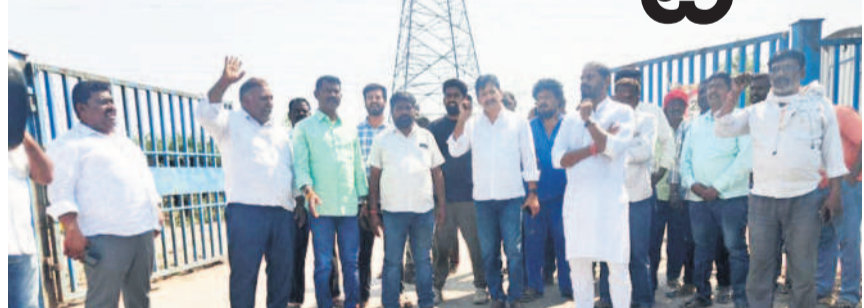
మల్యాలపల్లి గేట్ ఎదుట నిరసన వ్యక్తం చేస్తున్న యాష్ లాభి, టిప్పర్ అసోసియేషన్ నాయకులు

పెద్దపల్లి, మార్చి 9 (సమస్తి తెలంగాణ): బూడిద లోడింగ్ ను ఎన్టీపీసీనే చేపట్టాలని, ఒక్కో టిప్పర్ కు ₹4800 వసూలు చేస్తున్న దళారుల నుంచి తమకు ఏముక్తి కల్పించాలని లాభి, టిప్పర్ ఓనర్లు, డ్రైవర్లు, క్షీనర్లు డిమాండ్ చేశారు. ఈ మేరకు సోమవారం అంతర్గత మండలం మల్యాలపల్లి గేట్ వద్ద యాష్ టిప్పర్ లాభి అసోసియేషన్ ఆధ్వర్యంలో నిరసన తెలిపారు. బూడిద లోడింగ్ వ్యాపారం నుంచి తమకు ఏముక్తి కల్పించాలని డిమాండ్ చేశారు. ఇక్కడి నుంచి ఎక్కడికైనా బూడిద రవాణాను సైతం తామే చేస్తామని స్పష్టం చేశారు. ఎన్టీపీసీని నిర్మూలించాలని డిమాండ్ చేశారు. డిమాండ్ చేపట్టాలని, టిప్పర్ ఓనర్ల తమ లాభి నుంచి బూడిద రవాణా చేపట్టేమని అభిప్రాయం ఇచ్చారు. తమ సమస్యను ఎన్టీపీసీ యాజమాన్యం పరిష్కరించే వరకు రవాణాను నిలిపివేసి నిరసన తెలపాలని డిమాండ్ చేశారు. అధికారులు, ప్రజా ప్రతినిధులు సంఘీభావం తెలిపి మద్దతుగా నిలవాలని వారు విజ్ఞప్తి చేశారు.