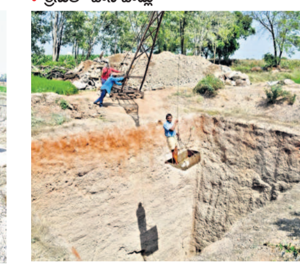
కరీంనగర్ జిల్లాలో బావిని తవ్వించుకు తెయ్యిన ద్వారా లోపలికి దిగుతున్న రైతు మధు