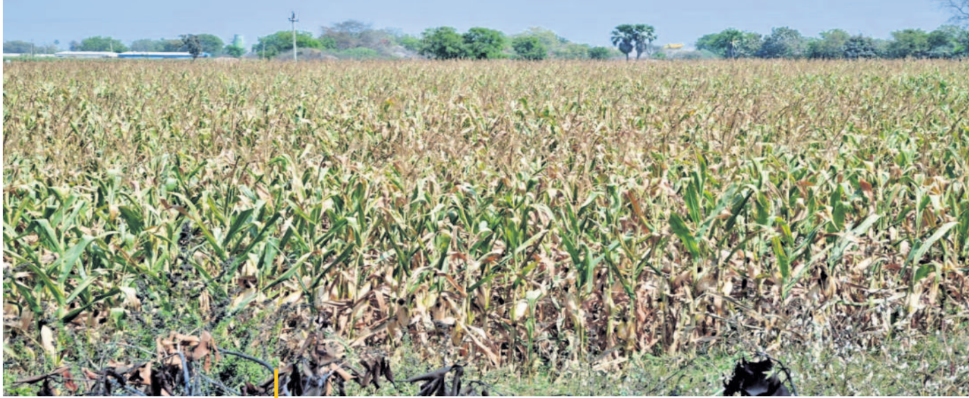
జాడలేని నీటి చుక్క.. ఎండిన మక్క.. కరీంనగర్ జిల్లాలో సాగునీరు అందడం లేదు. దీంతో పంటలు ఎక్కడిక్కడ ఎండిపోతున్నాయి. ఎకరాల కొద్దీ పంట నేలపాలవుతున్నది. మాంకొండూరు మండలం చెంబర్ల గ్రామజీవారంలో ఎండిన మక్కజొన్న పంట