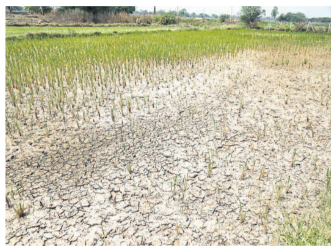
సంగారెడ్డి జిల్లా పుల్లూర్ మండలం ఇసుజిపేట గ్రామంలో నీళ్లులేక బీటలు వారిన వరి చేసే ప్రభుత్వం సమయానికి నీళ్లు ఇవ్వకపోవడంతోనే ఈ పరిస్థితి తలెత్తినది రైతు వావియూడు