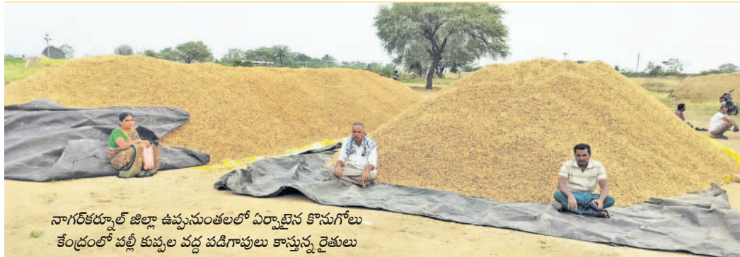
నాగర్జునాబాద్ జిల్లా ఉప్పునుంతులలో ఏర్పాటైన కొనుగోలు కేంద్రంలో పల్లి కుప్పల వద్ద పడిగావులు కాస్తున్న రైతులు