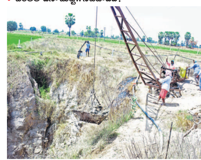
సాగునీళ్లు రాకపోవడంతో రైతులు బావుల వైపు మళ్లుతున్నారు. యాదాద్రి భువనగిరి జిల్లా గుండాల మండలం బురుజు బావి వద్ద బావిలో మట్టిని తోడిపిస్తున్న రైతు.