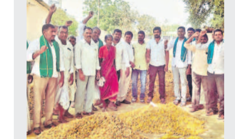
జిల్లా జిల్లా మేట్పల్లి వ్యవసాయ మార్కెట్ యార్డులో నిరసన తెలుపుతున్న పసుపు రైతులు