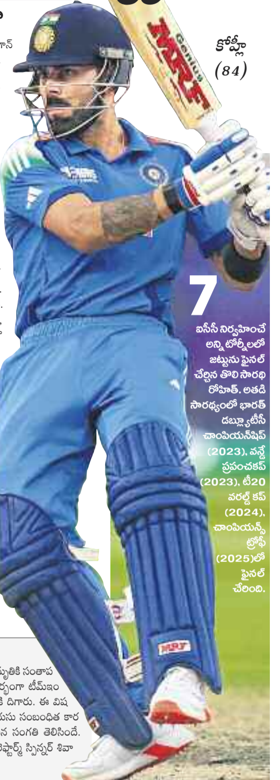
కోహ్లా (84) ఐసీసీ నిర్వహించే అన్ని టోర్నీలలో జట్టును పైనల్ చేర్చిన తొలి సారథి రోహిత్. అతడి సారథ్యంలో భారత్ దబ్బ్యూటీసీ ఛాంపియన్షిప్ (2023), వన్డే ప్రపంచకప్ (2023), టీ20 వరల్డ్ కప్ (2024), ఛాంపియన్స్ ట్రోఫీ (2025)లో పైనల్ చేరింది.

బోలింగ్ బలహీనంగా ఉన్నప్పటికీ పట్టుమైన బ్యాటింగ్ లైవ్ ఉన్న ఆస్ట్రేలియా.. భారత్ స్పిన్లపై దాడికి తలొగ్గక తప్పలేదు. షమీ తన రెండో ఓవర్లోనే ఓవర్లోనే కనీసీని డెక్కాట్ చేసి భారత్ కు తొలి బ్రేక్ ఇచ్చాడు. టీమ్ ఇండియాకు కొరకరాని కొయ్య అయిన హెడ్ (89) కూడా ఎక్కువసేపు క్రీజులో నిలవలేకపోయాడు. మరో ఓవర్.. తాను వేసిన తొలి ఓవర్ (ఇన్నింగ్స్ 9వ)లో రెండో బంతికి హెడ్ ను బెట్ చేయడంలో మెన్ ఇన్ బ్లూ ఊరి పీల్చుకుంది. అయితే స్పిట్.. క్రీజులో అడ్డుగడలా నిలబడ్డాడు. మొదట హెడ్ తో తర్వాత లబూషేన్ (29), కేలీతో అతడు కీలక భాగస్వామ్యాలను నెలకొల్పాడు. స్పిట్, లబూషేన్ ద్వయాన్ని విడదీయడానికి రోహిత్.. ఆక్టర్, జడేజా, పరుతోతో నిరాటంకంగా దాడి చేయించాడు. ఎట్టకేలకు జడేజా 29వ ఓవర్లో లబూషేన్ ను విట్చే ముందు దొరకబుచ్చుకుని పార్టనర్షిప్ బ్రేక్ చేశాడు. అదే ఊపులో జడ్డూ.. ఇంగ్లీస్ (11)నూ వెనక్కిపంపాడు. కానీ స్పిట్ కు జడేజాని కేలీ భారత్ స్పిన్లపై విడదీయడానికి దిగాడు. 69 బంతుల్లో అర్ధ సెంచర్ పూర్తిచేసుకున్న స్పిట్.. ఐసీసీ నాకౌట్ లో తారిత విలువైన ఆటగాడో మరోసారి నిరూపించుకున్నాడు. మరో ఎండ్లో కేలీ.. పరుతో బోలింగ్లో భారీ సిక్సర్ బాదడమే గాక కులీదేవ్, హర్షిత్ ఓవర్లో రెండో సిక్సర్లు రాబట్టాడు. స్కోరును పెంచే క్రమంలో స్పిట్.. షమీ బోలింగ్లో క్రీస్ బాట్ అవడంతో మ్యాచ్ పై మళ్లీ భారత్ పట్టుబడింది. మ్యాచ్ వెల్ (7) ను ఆక్టర్ అద్భుతం చేశాడు బోల్ కట్టించాడు.