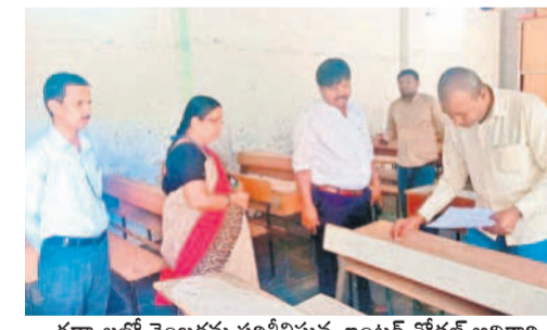
గద్వాలలో నెంబర్లను పరిశీలిస్తున్న ఇంటర్ నోడల్ అధికారి