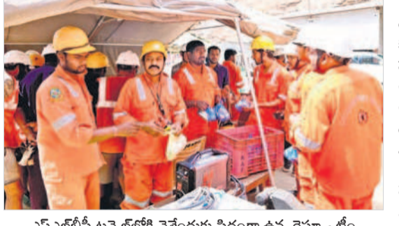
ఎన్ఎల్బీసీ టన్నెల్లోకి వెళ్లేందుకు సిద్ధంగా ఉన్న రెస్ట్రాక్టర్ టీమ్

కబలిత కన్వేయర్ బెల్ట్ అచ్చంపేట, మార్చి 4 : శ్రీశైలం ఎడమగట్టు ఎన్ఎల్బీసీ టన్నెల్ ప్రమాదంలో పూర్తిగా దెబ్బతిన్న తొలిసారి కన్వేయర్ బెల్టును ఎట్టకేలకు పునరుద్ధరించారు. కన్వేయర్ బెల్టు పునరుద్ధరణతో సహా యక చర్యలు వేగవంతం చేశారు. మంగళవారం కన్వేయర్ బెల్టు ద్వారా టన్నెల్ లోపల పేరుకుపో యక బండ రాళ్లు, మట్టి, బురదను బయటకు చేరవేస్తున్నారు. బెల్టుద్వారా గంటకు 800 టన్నుల మట్టి, బురదను బయటకు దంపి చేస్తున్నారు. టన్నెల్ లోపల 17వేల క్యూబిక్ అడుగుల బురద కూరుకుపో యింది. గ్యాస్ కట్టర్ తో బోరింగ్ మిషన్ విడిభాగాలను కటింగ్ చేస్తున్నారు. కటింగ్ భాగాలను లోకో ట్రైన్ ద్వారా బయటకు పంపుతున్నారు. లోపల చిక్కుకున్న ఎన్ఎమ్డి మండి కోసం జీవీఆర్ డేటా ఆధారంగా టన్నెల్ లోపల తవ్వకాలు జరు పుతున్నారు. టీటీఎం మిషన్ ముందుభాగం, వెనుక భాగంలో చిక్కుకున్న కోసం తవ్వకాలు జరు పుతున్నారు. మూడు చోట్ల ఎన్జీఆర్ఐ గుర్తించిన స్థలాల్లో దాదాపు పది శీట్ల వరకు తవ్వకాలు జరిపినా మట్టి, నీరు మాత్రమే వస్తుంది. అదేవిధంగా టన్నెల్లో భారీ గుర్రుల దాదాపు 450 మీటర్ల నుంచి టన్నెల్లోకి భారీ ఊట నీరు వచ్చి చేరు తప్పదు. సుమారు 5వేల లీటర్ల వరకు ఊటనీరు రావడంతో సహా యక చర్యలు అడ్డంకిగా మారాయి. ఆ నీటిని బయటకు పంపించే డబ్బు డీ వాటర్నింగ్ ప్రక్రియ కోసం పాతుకున్నది. 12 సంవత్సరాల చెందిన రెస్ట్రాక్టర్ బ్యాంకుల మూడు పిప్పలుగా సహాయక చర్యలు చేప డతున్నారు. టీటీఎం మిషన్ కింది భాగం, ముందుభా గంలో శిథిలాల కింద మృతదేహాలు ఉండొచ్చని తవ్వకాలు జరు పుతున్నారు. అయితే గ్రౌండ్ పెనిట్రేటింగ్ రాడార్ టెక్నాలజీ ద్వారా టన్నెల్ లోపల సాగినింగ్ చేస్తుండగా ఇదువేల మెట్లని భాగాలు ఉన్నట్లు స్పానింగ్ గర్తించారు.