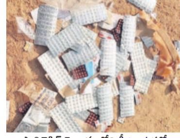
పాలిటిక్స్ మైదానంలోని సీఎం సభలో వైద్య, ఆరోగ్య సీబియూడి పారబోసిన మందులు

వనపర్తి, మార్చి 4 (నమస్తే తెలంగాణ) : ప్రభుత్వ డబ్బాసలో గతంలో మందిల మందుల సరఫరా లేక వేద ప్రజలు అప్పులు పడుతున్నారు. సర్కారు డబ్బాసలో వైద్య సంగం మంది రోగులు బయటి మందులు కొంటున్నారు. ఈ క్రమంలో ఇటీవల సీఎం రివంత్ రెడ్డి బహుళం గుభ పాలిటిక్స్ మైదానంలో జరిగిన సంగతి విడితప్పే. సీఎం రాక సందర్భంగా వైద్య శిబిరం ఏర్పాటు చేసింది. ఈ శిబిరంలో ఓఆర్ఎస్ ప్యాకెట్లతో పాటు మరో 20రకాల మందులను అందుబాటులో ఉంచారు. అంతవరకు బాగానే ఉంది. అయితే, సీఎం సభ ఆనంతరం మెడికల్ సీబియూడి ఆ శిబిరంలో ఉన్న మందులను అక్కడే వదలి వేయడంతో పాటు మరి కొన్ని మందులను కాల్చి వేసిన ఘటన అలస్యంగా వెలుగు చూసింది. కాగా, మైదానంలో శిబిరాలను తొలగిస్తున్న క్రమంలో కొంత అలస్యంగా ఇది బయట పడింది. వైద్య సీబియూడి చేసిన సిద్ధాంతాన్ని చూసిన పలు పురుగుల అధికారులకు సమాచారం ఇచ్చారు. అప్పటికే మందులు కాల్చివేయడం, మరి కొన్ని మట్టిలో కలిపి వేయడం, ఇంకా కొన్ని అటు.. ఇటుగా పడివేయడం జరిగింది. సీఎం సభలో ప్రజల కోసం అత్యవసర పరిస్థితిని గుర్తించి ఏర్పాటు చేసిన శిబిరంలో తెచ్చిన మందులను వదిలేసిన నిర్లక్ష్య మనస్తో జిల్లా వైద్య ఆరోగ్య శాఖ అధికారులు సైతం సమర్థనీయంగానే వ్యవహరించడం విమర్శలకు దారితీసింది. జిల్లా కేంద్రంలోనే ఇంతలా సీఎం సభలో నిర్లక్ష్యం ఉంటే ఇక లోపల ఎలా ఉంటుందో అన్న