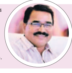
మాజీ మంత్రి నిరంజన్ రెడ్డి