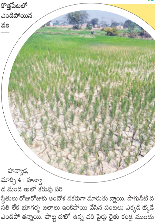
కొత్తపేటలో ఎండిపోయిన పంట