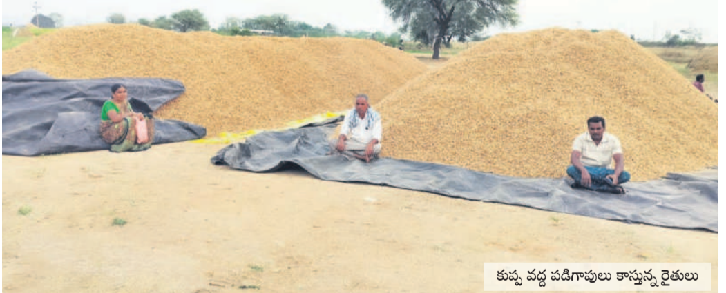
కుప్ప వద్ద పడిగావులు కాస్తున్న రైతులు