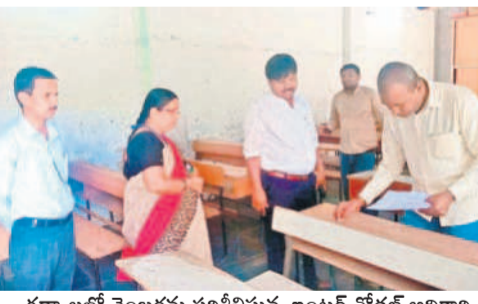
గద్వాలలో నెంబల్లను పరిశీలిస్తున్న ఇంటర్ నోడల్ అధికారి