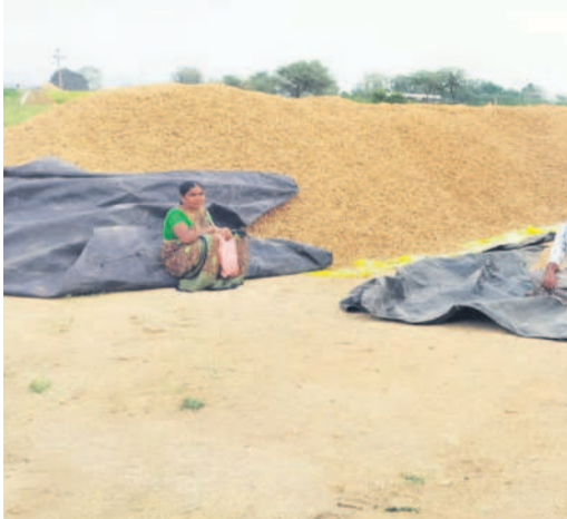
కుప్ప వద్ద పడిగావులు కాస్తున్న రైతులు