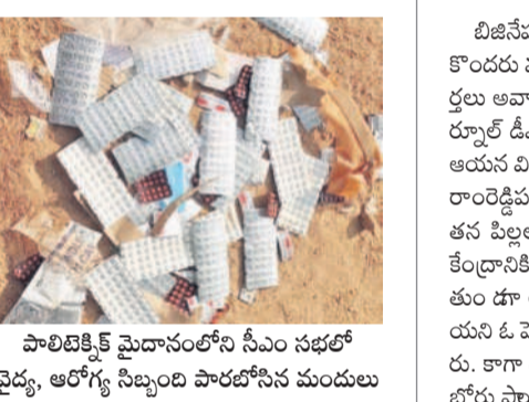
పాలిటిక్లిక్ మైదానంలోని సీఎం సభలో వైద్య ఆలోగ్య సిబ్బంది పారబోసిన మందులు సందేహలు వెల్ల డుతున్నాయి.

వనపర్తి, మార్చి 4 (నమస్తే తెలంగాణ) : ప్రభుత్వ డిమాండ్ లో గతంలో మంది మందుల సరఫరా లేక వేద ప్రజలు అవస్థ పడుతున్నారు. సర్కారు డిమాండ్ లో అలకు వైద్య సంగం మంది రోగులు బయటి మందులు కొంటున్నారు. ఈ క్రమంలో ఇటీవల సీఎం రివంత్ రెడ్డి బహుళం గుభ పాలిటి క్లిక్ మైదానంలో జరిగిన సంగతి విడితమే. సీఎం రాక సందర్భంగా వైద్య శిబిరం ఏర్పాటు చేసింది. ఈ శిబిరంలో ఓఆర్ఎస్ ప్యాకెట్ల తోపాటుమరో 20క రా మందులను అందుబా డులో ఉంచారు. అంతవరకు బాగానే ఉంది. అయితే, సీఎం సభ అనంతరం మెడికల్ సిబ్బంది ఆ శిబిరంలో ఉన్న మందులను అక్కడి వదలి వేయడంతో పాటు మరి కొన్ని మందులను కాల్చి వేసిన ఘటన అలస్యంగా వెలుగు చూసింది. కాగా, మైదానంలో శిబిరాలను తొలగిస్తున్న క్రమంలో కొంత అలస్యంగా ఇది బయట పడింది. వైద్య సిబ్బంది చేసిన నిర్వాహణ చూసిన పలు పురు అధికారులకు సమా చారం ఇచ్చారు. అప్పటికే మందులు కాల్చిపోవడం, మరి కొన్ని మట్టిలో కలిపి పోవడం, ఇంకా కొన్ని అటు.. ఇటుగా పడిపోవడం జరిగింది. సీఎం సభలో ప్రజల కోసం అత్యవసర పరిస్థితిని గుర్తించి ఏర్పాటు చేసిన శిబిరంలో తెచ్చిన మందులను వదిలేసిన నిర్లక్ష్య మనస్తత్వం జిల్లా వైద్య ఆలో గ్య శాఖ అధికారులు సైతం సమర్థనీ యంగానే వ్యవ హరించడం విమర్శలకు దారి తీసింది. జిల్లా కేంద్రంలోనే ఇంతలా సీఎం సభలో నిర్లక్ష్యం ఉంటే ఇక లోపల ఎలా ఉంటుండో అన్న