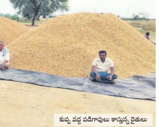
కుప్ప వద్ద పడిగావులు కాస్తున్న రైతులు