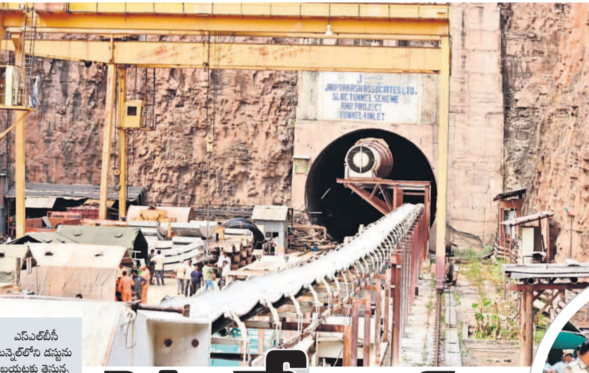
ఎన్ఎల్బీసీ టన్నెల్లోని డబ్బును బయటకు తెచ్చున్న కన్వేయర్ బెల్ట్