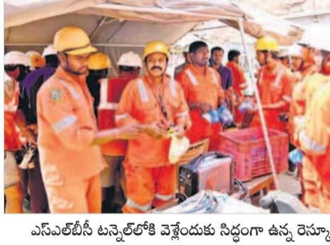
ఎన్ఎల్బీసీ టన్నెల్లోకి వెళ్లేందుకు సిద్ధంగా ఉన్న రెస్ట్రాక్టర్ టీమ్

యక చర్యలకు అడ్డంకిగా మారింది. ఆ నీటిని బయటకు పంపించే డబ్బు డీ వాటర్నింగ్ ప్రక్రియ కొన సాతున్నది. 12 సంస్థలకు చెందిన రెస్ట్రాక్టర్ల ద్వారా మూడు షిఫ్టులుగా సహాయక చర్యలు చేప డడుతున్నారు. టీటీఎం మిషన్ కింది భాగం, ముందుభా గులో శిథిలాల కింద మృతదేహాలు ఉండొచ్చని తవ్వకాలు జరు పుతున్నారు. అయితే గ్రౌండ్ పెనిట్రేటింగ్ రాడార్ టెక్నాలజీ ద్వారా టన్నెల్ లోపల సాగినింగ్ చేస్తుండగా బడువట్ల మెత్తని భాగాలు ఉన్నట్లు స్పానింగ్ గుర్తించారు.