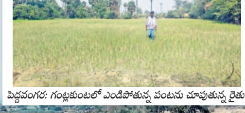
పెద్దవంగర: గంట్లకుంటలో ఎండిపోతున్న పంటను చూపుతున్న రైతు

10 వరంగల్, బుధవారం 5 మార్చి 2025 MAHABUBABAD