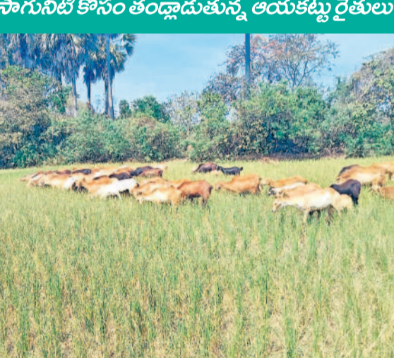
గంట్లకుంటలో ఎండిపోయిన వరి పంటను మేస్తున్న గొల్లెలు, గేదెలు

గుండ్రాతిమడుగుకు చెందిన రైతులకు పాకాల ఏరు నీటి ఆధారం. సుమారు 1500 ఎకరాలకు పైగా యాసంగిలో వివిధ పంటలు సాగు చేసేవారు. అయితే, రెండేళ్ల నుంచి నీరు సరిగ్గా ఉండడం లేదు. దీంతో ఈ ఏడాది కొందరు రైతులు పంటలు వేయడం మానేయగా, మరికొందరు నీళ్లు వస్తాయనే ఆశతో వరి, మినుములు, వెసర వంటి