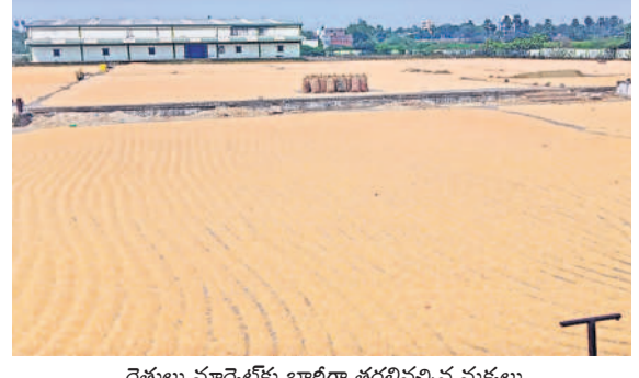
రైతుల మార్కెట్కు భారీగా తరలివచ్చిన మక్కలు

నర్సంపేట, మార్చి 4 : నర్సంపేట వ్యవసాయ మార్కెట్లకు మక్కలతో కళకళలాడింది. రైతులు భారీగా తీసుకురావడంతో మార్కెట్లో ఎటువంటి హామీనూ పచ్చని పరదా కప్పినట్లు కనిపించింది. అయితే రోజుల తరబడి అలాగే ఉండడంతో యూద్దాల్లి మొత్తం మక్కలతో నిండిపోయింది. గ్రామాల్లో మక్కలు అరబోసేందుకు సరైన కల్లాలు, స్టలాలు లేక రైతులు ఇక్కడికి తరలివస్తున్నారు. ఒక దశలో మార్కెట్లో ఆరబోసేందుకు స్టలం సరిపోక రైతులు ఇబ్బందులు పడుతున్నారు. మార్కెట్లో కాలుతీసి కాలు వేసే పరిస్థితి లేకుండా మక్కలు ఉన్నాయి. మక్కలు సరిగ్గా ఎండక రైతులు రోజుల తరబడి మార్కెట్లోనే ఉంటున్నారు. వ్యాపారులు తేమ చూసి మక్కలను విక్రయిస్తుండగా తేమ శాతం తక్కువ ఉన్న మక్కలను మాత్రమే ప్రైవేట్ వ్యాపారులు కొనుగోలు చేస్తున్నారు. ముఖ్యంగా 14-15 శాతం ఉండేలా చూసుకోవాలని సూచిస్తున్నారు. అంతకంటే ఎక్కువ ఉన్న మక్కలను కొనుగోలుచేసే రైతులు స్థానికంగా ఉన్న ఈ మార్కెట్ యూద్దాల్లి రోజుల తరబడి ఆరబోస్తున్నారు. మార్కెట్కు వచ్చిన రైతు వారం, పది రోజులు ఇక్కడి ఉంటూ మక్కలను వ్యాపారులకు విక్రయిస్తున్నారు. ప్రభుత్వ మద్దతు ధర క్వింటాల్కు రూ.2200లు మాత్రమే పలుకగా ప్రైవేట్ వ్యాపారులు రూ.2310 నుంచి రూ.2380వరకు ధరలు పెట్టి మక్కలను కొనుగోలు చేస్తున్నారు. గడిచిన వారం రూ.2400 వరకు పలకడంతో రైతులు ప్రైవేటు ప్రైవేటు మొగ్గుచూపుతున్నారు. ఇదిలా ఉండగా మార్కెట్లో తాగునీటి, ఇతర సౌకర్యాలు లేక తీవ్ర ఇబ్బందులు పడుతున్నారు.