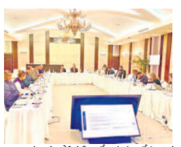
కారులను ప్రోత్సహించేందుకు ఉద్దేశించిన సంస్థ ఇది.

అతిచిన్న ఉపగ్రహాన్ని అమెరికా అంతరిక్ష పరిశోధన సంస్థ (నాసా) ప్రయోగించింది. ఇందుకు స్పేస్ ఎక్స్ ఫాల్కాన్ 9 రాకెట్ ని వినియోగించింది. యూఎస్ఎస్ డీపి రసాయన ఆయుధాల తయారీ, రవాణా, వినియోగం లేకుండా చేసేందుకు ఐక్యరాజ్యసమితి నిరాయుధీకరణ వ్యవహారాల వ్యవస్థ ఒక అవగాహన సదస్సును ఫిబ్రవరి 25 నుంచి 27 వరకు నిర్వహించింది. ఆంధ్రప్రదేశ్ లోని పాలసముద్రంలో ఉన్న నేషనల్ అకాడమీ ఆఫ్ కస్టమ్స్, ఇన్ డైరెక్ట్ ట్యూక్స్ అండ్ నార్మోటిక్స్ లో ఈ సదస్సు జరిగింది. ఆసియా-పసిఫిక్ ప్రాంతంలోని దేశాలకు ఈ అవగాహనను కల్పించారు. భద్రతా మండలిలోని 1540 తీర్మానం మేరకు ఈ తరగతులు జరిగాయి. జీవోజీపీ-బజీవో దీని పూర్తి రూపం బే ఆఫ్ బెంగాల్ ప్రాంతం - ఇంటర్ గవర్నమెంట్ ఆర్గనైజేషన్. 2003లో ఏర్పాటైన ఈ వ్యవస్థకు భారత్ నాయకత్వ బాధ్యతను తీసుకోనుంది. ఇందులో భారత్ తో పాటు బంగాదేశ్, మాల్దీవులు, శ్రీలంక సభ్యత్వాన్ని కలిగి ఉన్నాయి. ఆయా దేశాల్లోని మత్స్య