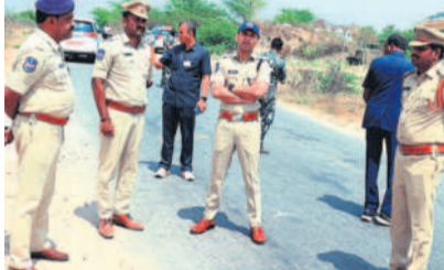
చెక్పోస్టు ఏర్పాటు చేసే ప్రాంతాన్ని పరిశీలిస్తున్న ఎస్సీ

● అమ్మనోలు మూసీ వారు వద్ద చెక్పోస్ట్ ● ఎస్సీ శరణ్ చంద్రవర్మ నార్కట్ పల్లి, మార్చి 4 : మండలంలోని అమ్మనోలు మూసీ పరివాహక ప్రాంతం నుంచి ఇసుకను అక్రమంగా తరలిస్తే కఠిన చర్యలు తీసుకుంటామని ఎస్సీ శరణ్ చంద్రవర్మ హెచ్చరించారు. మంగళవారం మూసీ పరివాహక ప్రాంతంలోని ఇసుక రీవ్ లను ఆయన సందర్శించారు. వారును గ్రామాన్ని పరిశీలించారు. ఈ సందర్భంగా ఆయన మాట్లాడుతూ ఇసుక రవాణాకు అడ్డుకట్ట వేసేందుకు అమ్మనోలు గ్రామంలో ప్రత్యేక చెక్పోస్టును ఏర్పాటు చేస్తున్నట్లు తెలిపారు. వచ్చిపోయే వాహనాల వివరాలు