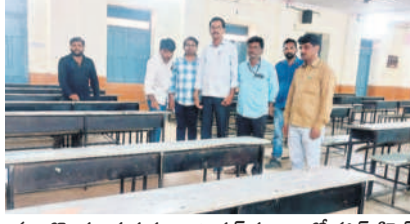
నందికొండ : ప్రభుత్వ జూనియర్ కళాశాలలో హాల్ టెలికాం సందర్శన చేస్తున్న అధికారులు, సిబ్బంది

నల్లగొండ, మార్చి 4: ఈ నెల 5 నుంచి 20 వరకు నిర్వహించే ఇంటర్నెట్ పరీక్షలకు ఏర్పాటు పూర్తి చేశారు. ఉదయం 9 నుంచి మధ్యాహ్నం 12 గంటల వరకు పరీక్షలు జరుగుతున్నట్లు సమావేశంలో ఆయా పరీక్ష కేంద్రాల వద్ద 144 క్లెస్ట్ వివిధాలని కలెక్టర్ ఇలా త్రిపాఠి తాన్లూర్లును ఆదేశించారు. పరీక్ష సందర్భంగా 200 మీటర్ల పరిధిలో ఎవరినీ అనుమతించవద్దని ఆదేశించారు. ఆయా ప్రాంతాల్లో జిల్లా స్టాంపుల మూసీ వేయించాలని, పరీక్ష కేంద్రంలో మౌలిక వసతులు కల్పించాలని సూచించారు. ప్రస్తుతం వేసవి తీవ్రత వృద్ధి అయి కేంద్రాల్లో తాగునీటిని, వైద్య సిబ్బందిని అందుబాటులో ఉంచాలని కలిపి సమావేశం నిర్వహించారు. 7730868967కు సమాచారం ఇవ్వాలని విద్యార్థులు అధికారులు సూచించారు.