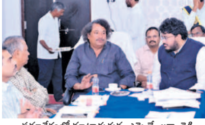
సమావేశంలో మాట్లాడుతున్న ఎమ్మెల్యే లక్ష్మారెడ్డి

● ఎమ్మెల్యే లక్ష్మారెడ్డి మిర్యాలగూడ, మార్చి 4: వేసవిలో నియోజకవర్గంలోని అన్ని గ్రామాల్లో తాగునీటి సమస్య రాకుండా చూడాలని ఎమ్మెల్యే బత్తుల లక్ష్మారెడ్డి అధికారులను ఆదేశించారు. మంగళవారం పట్టణంలోని సబ్ కలెక్టర్ కార్యాలయంలో ఆర్డర్లు జారీ చేసి, మున్సిపల్ ఇంజనీరింగ్, పబ్లిక్ వర్క్స్, ఎలక్ట్రిసిటీ, మున్సిపల్ అధికారులతో నిర్వహించిన సమావేశంలో ఆయన మాట్లాడారు. వేసవిలో తాగునీటి అందజేత, మిక్సింగ్ కోతలు లేకుండా సంబంధిత అధికారులు చర్యలు తీసుకోవాలన్నారు. అసంపూర్ణ దామరచర్ల మండలంలోని ఇండియా సిమెంట్, అలంజా(పెన్నా) సిమెంట్ యూజిఎస్ఎల్తో నిర్వహించిన సమావేశంలో మాట్లాడారు.