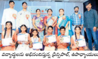
విద్యార్థులను అభినందిస్తున్న ప్రిన్సిపాల్, ఉపాధ్యాయులు