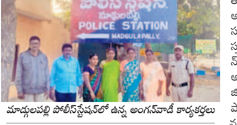
మాధులపల్లి పోలీస్ స్టేషన్లో ఉన్న అంగన్వాడీ కార్యకర్తలు