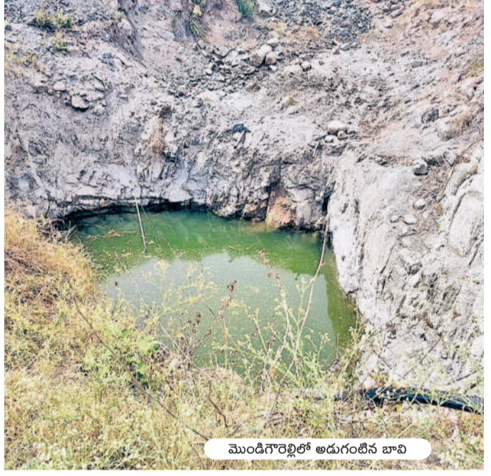
మొండిగౌరెడ్డిలో అడుగుంట బావి

అర్హులైనా రుణమాఫీ కాంగ్రెస్ ప్రభుత్వం విధించిన పథకాలతో జిల్లా రైతాంగానికి అన్యాయం జరిగింది. పంట రుణమాఫీకి పెట్టిన పథకాలతో కేవలం కొంతమందికి మాత్రమే లబ్ధి చేకూరింది. టీఆర్ఎస్ ప్రభుత్వ హయాంలో రూ. లక్షలలోపు పంట రుణాల మాఫీతో 1.26 లక్షల మంది రైతులకు లబ్ధి చేకూరితే, కాంగ్రెస్ ప్రభుత్వం విధించిన పథకాలతో చాలా మంది రైతులు రుణమాఫీకి దూరమయ్యారు. పట్టణాల పాసుపుస్తకాలను పదిగణంలోకి తీసుకొని టీఆర్ఎస్ ప్రభుత్వం రూ. లక్షలలోపు పంట రుణాలను మాఫీ చేస్తే.. కాంగ్రెస్ ప్రభుత్వం రేషన్ కార్డును ప్రామాణికంగా తీసుకోవడంతోనే సుమారు లక్ష మంది రైతులు నష్టపోయారు. జిల్లావ్యాప్తంగా 2.50 లక్షల మంది రైతులుండగా.. సుమారు 2 లక్షల మంది రైతులు పంట రుణాలను తీసుకుంటే వీరిలో కేవలం 1.01 లక్షల మంది రైతులను మాత్రమే రూ.2 లక్షలలోపు రుణమాఫీకి అర్హులుగా కాంగ్రెస్ ప్రభుత్వం గుర్తించింది. ఒకేసారి రూ.2 లక్షలలోపు పంట రుణాలను మాఫీ చేస్తామని హామీలిచ్చి విడతల వారీగా రుణాలను మాఫీ చేస్తుంది. రూ.2 లక్షలలోపు రుణాలను మాఫీ చేస్తామని ప్రభుత్వం ప్రచారం చేసుకుంటుంది కానీ వాస్తవానికి ఇంకా రూ.2 లక్షలలోపు రుణమాఫీ పూర్తికాలేదు. నాలుగో విడత రుణమాఫీకి సంబంధించి అర్హుల జాబితాను జిల్లా వ్యవసాయాధికారులు విడుదల చేసినప్పటికీ సంబంధిత రైతుల బ్యాంకు ఖాతాల్లో మాత్రం ఇంకా డబ్బులు జమకాలేదు. జాబితాలో పేరు వచ్చిన రైతులు ఎప్పుడూ తమ రుణాల మాఫీ అవుతాయంటూ వ్యవసాయాధికారుల చుట్టూ ప్రదక్షిణలు చేస్తున్నారు. ఇప్పటివరకు రూ.1.50 లక్షల రుణాలలోపు ఉన్న రూ.750 కోట్ల రుణాలను మాఫీ చేయగా.. నాలుగో విడతలో రూ.1.50 లక్షల నుంచి రూ.2 లక్షలలోపు రుణాలను మరో 10,660 మంది రైతులకు సంబంధించిన రూ.98.17 కోట్ల రుణాలను మాఫీ చేయాల్సి ఉన్నది.