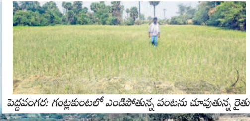
పెద్దవంగర: గంట్లకుంటలో ఎండిపోతున్న పంటను చూపుతున్న రైతు

10 వరంగల్, బుధవారం 5 మార్చి 2025 HANUMAKONDA