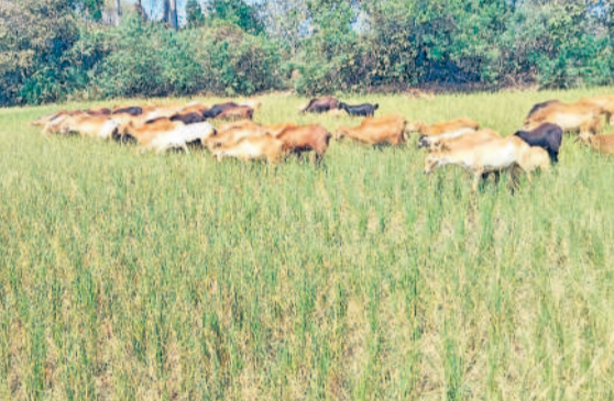
గంట్లకుంటలో ఎండిపోయిన వరి పంటను మేస్తున్న గొల్లెలు, గేదెలు

ద్వారా పంటలకు మళ్లించి మరికొందరు కాపాడుకునే ప్రయత్నం చేస్తున్నారు. ఇంకో వారంపాటు ఇదే పరిస్థితి ఉంటే పంటలు పూర్తిగా ఎండిపోతాయని ఆవేదన చెందుతున్నారు. తాళ్లపూసపల్లి చెరువుకు చేరుకునే త్రీరాంసాగర్ ప్రాజెక్ట్ నీటిని మత్తడి ద్వారా పాకాల ఏరుకు మళ్లించి పంటలను కాపాడాలని రైతులు ప్రభుత్వాన్ని కోరుతున్నారు.