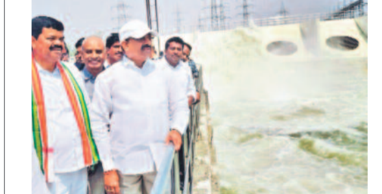
భద్రాద్రి జిల్లా ములకలపల్లి మండలం కమలాపురం పంపుహౌస్ నుంచి విడుదలవుతున్న నీతారామ ప్రాజెక్టు నీళ్లు

సిద్దిపేట, మార్చి 5 (నమస్తే తెలంగాణ ప్రతినిధి): తెలంగాణకు అన్యాయం చేయడమే ఆంధ్రప్రదేశ్ ముఖ్యమంత్రి చంద్రబాబు చెప్పన్న సమన్వయం అని మాజీ మంత్రి, బీఆర్ఎస్ ఎమ్మెల్యే హరీశ్ రావు ఆగ్రహం వ్యక్తంచేశారు. చంద్రబాబుకు చిత్తశుద్ధి ఉంటే తెలంగాణ నిర్మూలన ప్రాజెక్టుపై ఆభ్యంతరం లేదని కేంద్రానికి తీవ్ర రాయాలని డిమాండ్ చేశారు. తెలంగాణకు అన్యాయం చేయడంలో చంద్రబాబు, జగన్ ఇద్దరిద్దీ ఒకే బాట అని విమర్శించారు. తెలంగాణ నీటి హక్కుల కోసం పోరాడేది బీఆర్ఎస్ పార్టీయేనని స్పష్టంచేశారు. బుడవారం ఆయన సిద్దిపేటలో మీడియాతో మాట్లాడుతూ.. ఇటీవల చంద్రబాబు చేసిన ప్రసంగంపై ఘాటు వ్యాఖ్యలు చేశారు. తాను కాశీశ్వరం ప్రాజెక్టును వ్యతిరేకించలేదని, సముద్రంలో కలిసి నీళ్లను మాత్రమే తీసుకువచ్చానని, తెలంగాణ, ఏపీ తనకు రెండు కండ్లలాంటివి, రెండు రాష్ట్రాలకు సమన్వయం జరగాలంటూ చంద్రబాబు చేసిన వ్యాఖ్యలను తీవ్రంగా ఖండిస్తున్నట్లు హరీశ్ రావు >3వ పేజీలో