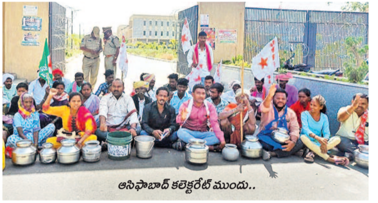
ఆసిఫాబాద్ కలెక్టరేట్ ముందు..

కాంగ్రెస్ ప్రభుత్వం తమకు తాగేందుకు గుక్కెడు నీళ్లు కూడా అందించడం లేదని మండిపడుతూ వాంకీడి మండలం ఎస్ఐ గ్రామస్థులు బుడవారం ఆందోళనలూ బట్టారు. దాదాపు 25 కిలో మీటర్ల దూరంలో ఉన్న కుటుంబం తీరి ఆసిఫాబాద్ జిల్లా కలెక్టరేట్ వద్దకు ఖాళీ బిందెలతో వచ్చి ధర్నాకు దిగారు.