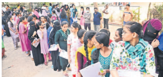
వరంగల్ లోని ఏవీవీ కళాశాల వద్ద క్యూలో ఉన్న విద్యార్థులు

ప్రారంభమైన ఇంటర్నెట్ పరిశీలనలు ఉమ్మడి వరంగల్ జిల్లా వ్యాప్తంగా ఇంటర్నెట్ పరిశీలనలు మొదటి సంతకరం పరిశీలన బుధవారం ప్రశాంతంగా జరిగింది. ఉదయం 9 గంటల నుంచి పరిశీలన జరగనుండాగా, విద్యార్థులు ముందుగానే కేంద్రాలకు చేరుకోగా వారిని తనిఖీ చేసిన అనంతరం లోపలికి పంపించారు. సెంటర్లను కలెక్టర్లు, పోలీస్ ఉన్నతాధికారులు, ఇంటర్నెట్ అధికారులు సందర్శించారు. కాగా, మడికొండ, జనగామ, స్వేచ్ఛనుపూర్, నెక్కొండ, మహబూబాబాద్ లో ఒక సెంటర్ కు బదులు మరో సెంటర్ కు వచ్చిన విద్యార్థులను పోలీసులు తమ వాహనాల్లో కేంద్రాలకు తరలించారు. - నమస్తే నీటివర్సె, మార్చి 5