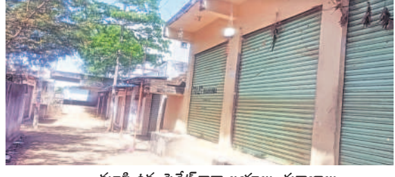
మానీ ఉన్న సైవేట్ కార్యాలయాలు, దుకాణాలు