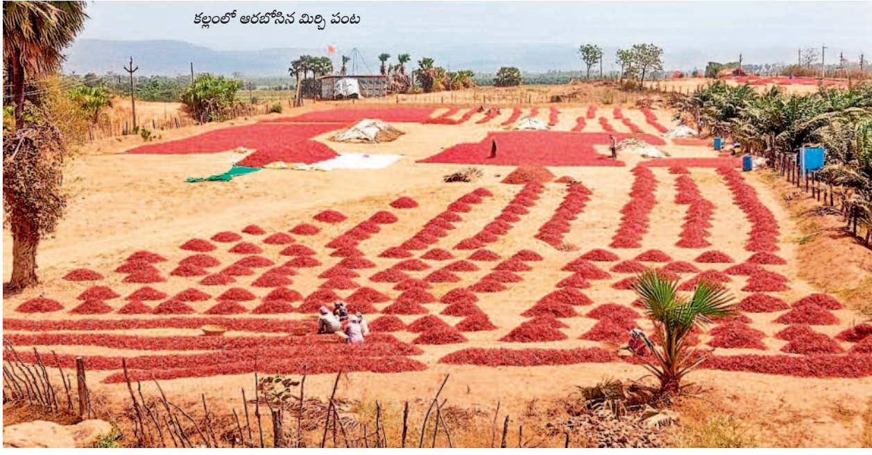
కల్లంలో ఆరబోసిన మిర్చి పంట