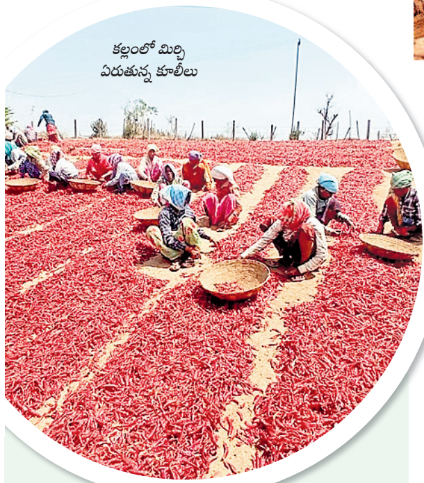
కల్లంలో మిర్చి ఏరుతున్న కూలీలు