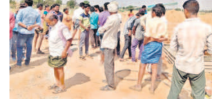
తాడూర్లో కేవలం పనులు అడ్డుకుంటున్న రైతులు

కేవలం పనులు అడ్డుకున్న రైతులు ఉప్పునుంతుల, మార్చి 5 : మండలంలోని తాడూర్ శివారంలో జరుగుతున్న కేవలం కాల్వ పనులు బుధవారం రైతులు అడ్డుకున్నారు. కేవలం కాల్వ పనులు భూములు కోల్పోయిన రైతులకు సష్ట పరిహారం చెల్లించకుండా ప్రభుత్వం ఇష్టానుసారంగా పనులు చేస్తే తమ పరిస్థితి ఏమిటని ఆగ్రహం వ్యక్తం చేశారు. పనులను నిలిపివేసి ఆందోళన చేపట్టారు. ఈ సందర్భంగా రైతులు మాట్లాడుతూ కాల్వ పనులు వల్ల భూమి కోల్పోయి దిక్కులేని పాశ్రమం యావచ్చున్నారు. ఈ విషయంపై ఎన్ఎస్సార్లు ఎమ్మెల్యే