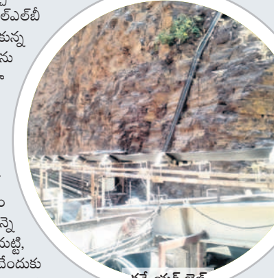
కన్నెయర్ డిల్లీ వెళ్లునూ తొలగించిన మట్టిని బయటకు తీసే మార్గమైన కన్నెయర్ డిల్లీ పనిచేయకపోవడంతో రెస్పాన్స్ టీం చేస్తున్న చర్యలకు ఫలితం లేకండా పోతోంది.

మృతదేహాల ఆచూకీకి రోజులు పట్టి అవకాశం.. కన్నెయర్ డిల్లీ తెగిపోవడంతో సహాయక చర్యలకు ఆటంకం కలిగింది. దీంతో మృతదేహాల గుర్తింపు ముగిసి రోజులు పట్టి అవకాశం ఉన్నట్లు రెస్పాన్స్ టీం బృందం తెలిపింది. సారంగంలో తెగిపోవడం చెల్లించిన కన్నెయర్ డిల్లీ నుంచే మరమ్మతులు చేయాలి ఉండడంతో దానిని ముగిసిన మరో రెండు రోజులు పట్టి అవకాశం వస్తున్నది. అప్పటి వరకు టన్నెల్ లో నీటితోపాటు బురద వరకు పేరుకుపోయే అవకాశం ఉన్నట్లు తెలిసింది. లోకో డ్రైనింగు గతంలో మారింది బురదను తర