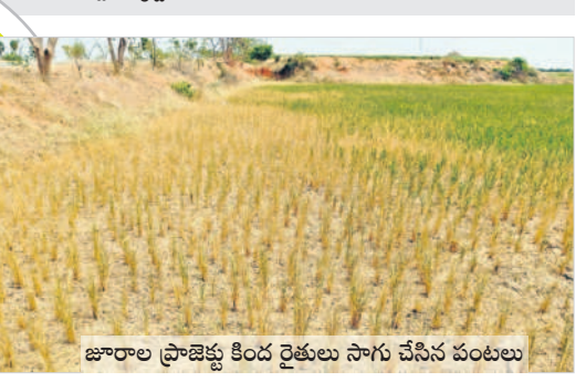
జూరాల ప్రాజెక్టు కింద రైతులు సాగు చేసిన పంటలు

నీటిని పొందుపు వాడుకుంటున్నాం - రహ్మానుల్లీన్, జూరాల ఎన్ఈఈ జూరాల ప్రాజెక్టు సామర్థ్యం తక్కువగా ఉండడం.. దీని మీద భీమా-1, భీమా-2, నెట్టింపాడు, కోయల్ సాగర్ ఆధారపడి ఉన్నాయి. అవసరాలకు తగ్గట్టు డ్యాంంలో నీరు లేదు. రైతులు నీటిని పొందుతూ వాడుకోవాలి. తాగునీటి కోసం వేసే ముగిసే వరకు 0.4 టీఎంసీలు వినియోగించాలి. పంటలు చేతికి రావాలంటే ఇంకా 1.2 టీఎంసీలు అవసరం. ప్రస్తుతం ప్రాజెక్టులో ఉన్ననీటి ఆధారంగా వారలంది పద్ధతిలో నీళ్లున్నాయి. సరిపెట్టుకోవాలంటే మూడు, నాలుగు రోజులకోసారి నీళ్లు అందిస్తున్నాం. దానిని రెండ్రోజులకు తగ్గించి పంటలు కాపాడే ప్రయత్నం చేస్తాం. ఇచ్చిన మాట ప్రకారం ఏప్రిల్ 15 వరకు అందిస్తాం. నారాయణపూర్ నుంచి ఇప్పటికే తక్కువగా వస్తుంది. ఈ విషయాన్ని ప్రభుత్వం దృష్టికి తీసుకెళ్లాం.