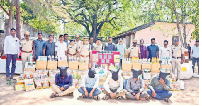
నకిలీ పురుగు మందుల విక్రయాలకు పాల్పడిన మూఠా అరెస్టును చూపిస్తున్న నీటి అంబర్ కిరీరూ