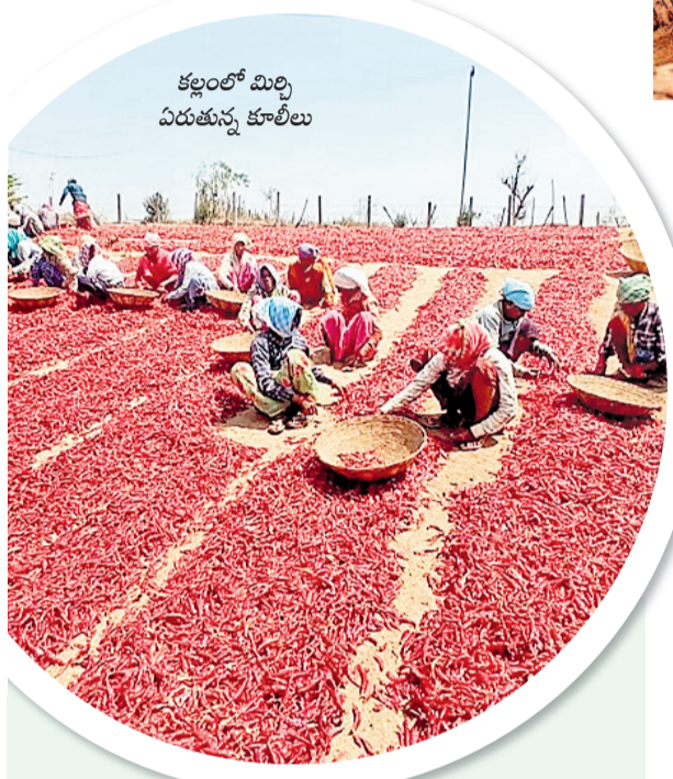
కల్లంలో మిర్చి ఏరుతున్న కూలీలు