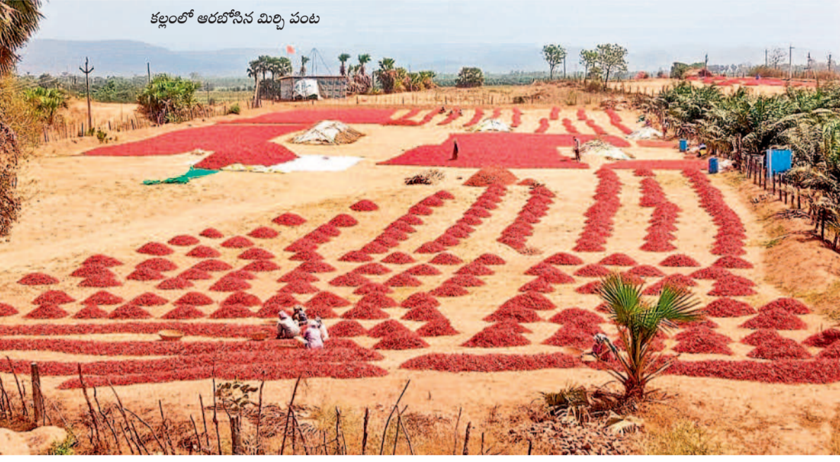
కల్లంలో ఆరబోసిన మిర్చి పంట