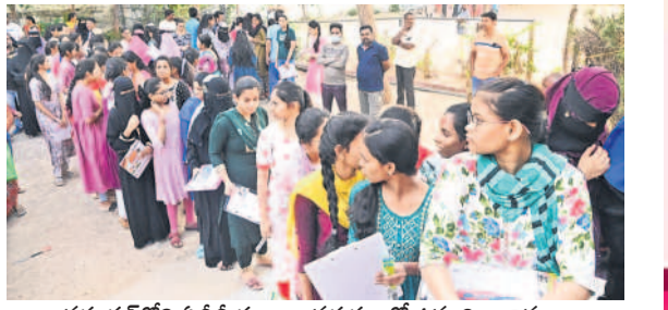
వరంగల్ లోని ఏవీవీ కళాశాల వద్ద క్యూలో ఉన్న విద్యార్థినులు

ప్రారంభమైన ఇంటర్నెట్ పరిశీలనలు ఉమ్మడి వరంగల్ జిల్లా వ్యాప్తంగా ఇంటర్నెట్ పరిశీలనలు మొదటి సంతకరం పరిశీలన బుధవారం ప్రశాంతంగా జరిగింది. ఉదయం 9 గంటల నుంచి పరిశీలన జరగనుండాగా, విద్యార్థులు ముందుగానే కేంద్రాలకు చేరుకోగా వారిని తనిఖీ చేసిన అనంతరం లోపలికి పంపించారు. సెంటర్లను కలెక్టర్లు, పోలీస్ ఉన్నతాధికారులు, ఇంటర్నెట్ అధికారులు సందర్శించారు. కాగా, మడికొండ, జనగామ, స్వేచ్ఛనుపూర్, నెక్కొండ, మహబూబాబాద్ లో ఒక సెంటర్ కు బదులు మరో సెంటర్ కు వచ్చిన విద్యార్థులను పోలీసులు తమ వాహనాల్లో కేంద్రాలకు తరలించారు. - నమస్తే నీటివర్సెస్, మార్చి 5