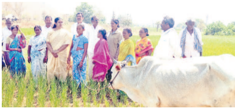
ఎండిన పంటలను పరిశీలించి, రైతులతో మాట్లాడుతున్న జడ్పీ మాజీ చైర్ పర్సన్ దావ వసంత