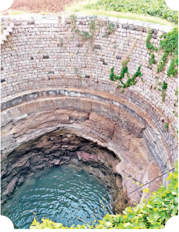
వికారాబాద్, మార్చి 5 (సమస్య తెలంగాణ)

తగా తనిఖీలు నిర్వహించి నిబంధనలు ఉల్లంఘించిన వారి పట్ల కఠినంగా వ్యవహరిస్తున్నది. ఇందులో లాగంగానే ఎఫ్ బీ పుడ్స్, అంబర్ పేట మాక్స్ బేకరీ, జై మాత, గో ఫ్రెండ్స్, వాన్ చిన్న, కేఎస్, మలకపేట స్వాగత బార్, స్పృహ బిజినెస్, ఆర్టీసీ క్రాస్రోడ్స్ డ్రెస్టర్ బార్, చిక్కడపల్లి మోర్ రిటేల్, జీడి మెట్ల వెంకటేశ్వర ఫార్మేషన్ పుడ్స్, మియాపూర్ పూర్ ఓ నేనరల్లో తనిఖీలు నిర్వహించారు. ఇసామియా బజార్లో వెంకటేశ్వర మెడికల్ సోర్స్, సుజాత డెయిరీ ఫాం, కో గోకుల్ ఛాల్ బండార్, ఎంజీ మాస్కోలో కరాచీ బేకరీ, సంతోష్ దాబా, మదీనా గూడలో మధురం టిఫిన్స్, మియాపూర్ సాయి పుడ్స్, జవహర్ నగర్ ఆహాట్ ఎంటర్ప్రైజెస్, బోల్కూర్లో 4 ఎం రెస్టారెంట్లలో అధికారులు తనిఖీలు చేపట్టారు.