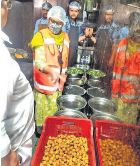
సీటింగ్లో, ఫిబ్రవరి 5 (సమస్య తెలంగాణ): ప్రజల ఆరోగ్యంతో చెలాటం అడుతున్న పుడ్ ఎస్టాబ్లిష్మెంట్లపై జిల్లాలోని పుడ్ సేఫ్టీ అధికారులు పరిశోధనలు చేశారు. అవకాశాలను పాటించి చనిపోవడం, రెస్టారెంట్లు, బార్లతో పాటు సూపర్ మార్కెట్లు, ఇన్స్టాల్డ్ అకర్ వాటిపై విస్తృత తనిఖీలు చేపట్టారు.

నిబంధనలు ఉల్లంఘించిన వ్యాపారులకు నోటీసులు