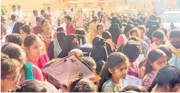
వికారాబాద్ జిల్లాలోని ఓ పరీక్షా కేంద్రానికి చేరుకున్న విద్యార్థులు

జిల్లాలో ఇంటర్ ఫస్ట్ యర్లో 8177 మందికిగాను 7937 మంది హాజరు