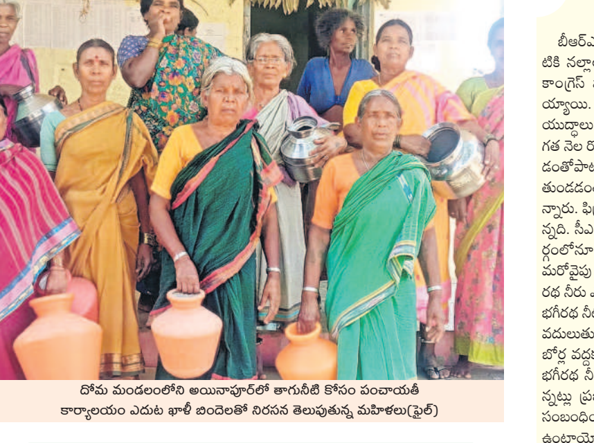
దోమ మండలంలోని అయినాపూర్లో తాగునీటి కోసం పంచాయతీ కార్యాలయం ఎదుట భారీ బందలతో నిరసన తెలుపుతున్న మహిళలు(ఫైల్)

తగా తనిఖీలు నిర్వహించి నిబంధనలు ఉల్లంఘించిన వారి పట్ల కఠినంగా వ్యవహరిస్తున్నది. ఇందులో లాగంగానే ఎఫ్ బీ పుడ్స్, అంబర్ పేట మాక్స్ బేకరీ, జై మాత, గో ఫ్రెండ్స్, వాన్ చిన్న, కేఎస్, మలకపేట స్వాగత బార్, స్పృహ బిజినెస్, ఆర్టీసీ క్రాస్రోడ్స్ డ్రెస్టర్ బార్, చిక్కడపల్లి మోర్ రిటేల్, జీడి మెట్ల వెంకటేశ్వర ఫార్మేషన్ పుడ్స్, మియాపూర్ పూర్ ఓ నేనరల్లో తనిఖీలు నిర్వహించారు. ఇసామియా బజార్లో వెంకటేశ్వర మెడికల్ సోర్స్, సుజాత డెయిరీ ఫాం, కో గోకుల్ ఛాల్ బండార్, ఎంజీ మాస్కోలో కరాచీ బేకరీ, సంతోష్ దాబా, మదీనా గూడలో మధురం టిఫిన్స్, మియాపూర్ సాయి పుడ్స్, జవహర్ నగర్ ఆహాట్ ఎంటర్ప్రైజెస్, బోల్కూర్లో 4 ఎం రెస్టారెంట్లలో అధికారులు తనిఖీలు చేపట్టారు.