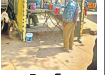
బస్ షెల్టర్ నా కిరాయికిచ్చారు..!

రంగారెడ్డి జిల్లాలో అల్లాడుతున్న అన్నదాతలు