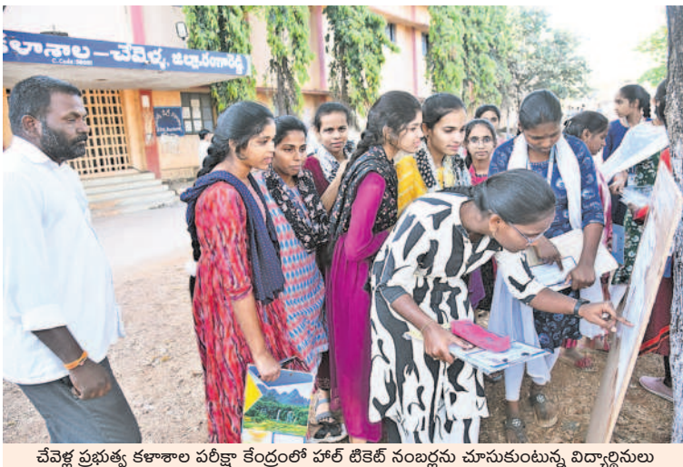
చేపక్ష ప్రభుత్వ కళాశాల పరీక్షా కేంద్రంలో హాల్ టికెట్ నబద్ధను చూసుకుంటున్న విద్యార్థులు