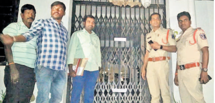
ఇబ్రహీంపట్నం లాజా పల్లి, మంగలపల్లిలోని దినకర రేడియో హాస్టల్ ను బుధవారం ఇబ్రహీంపట్నం పోలీసులు సీజ్ చేశారు. ఇబ్రహీంపట్నం ఆర్టిసో అసెంబ్లీ అధికారి మేరకు ఇబ్రహీంపట్నం సీజ్ జరగడం, రెవెన్యూ సిబ్బంది సీజ్ చేశారు. కొన్ని రోజుల కిందట ఆ హాస్టల్లో ఒంటరిగా ఉన్న ఓ యువతిపై ఆటోడ్రైవర్ అత్యాచారానికి పాల్పడడంతో అధికారులు వర్తమా తీసుకున్నారు. - ఇబ్రహీంపట్నం, మార్చి 5