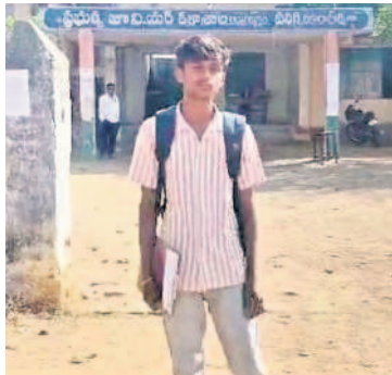
పరీక్షా కేంద్రానికి సగే అలసంగా రావడంతో లోనికి అనుమతించని అధికారులు

పరిగి : ఓ ప్రైవేట్ కళాశాల విద్యార్థి జీవితంతో అడుకున్నది. ఫీజు పూర్తిగా చెల్లించేంతవరకూ హాల్ టికెట్ ఇవ్వకపోవడంతో ఆ విద్యార్థి సమయానికి సదురు కేంద్రానికి చేరుకోకపోవడంతో పరీక్ష రాయకుండానే వెనుదిరగాల్సి వచ్చింది. వికారాబాద్ జిల్లా పరిగిలోని ప్రైవేట్ కళాశాలలో కళాశాలలో వార్ల సగే అనే విద్యార్థి చదువుతున్నాడు. ఫీజు చెల్లించలేదనే కారణంతో కళాశాల నిర్వాహకులు అతడికి హాల్ టికెట్ ఇవ్వలేదు.