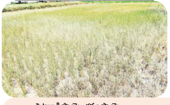
పెట్టుబడి పొయి.. కష్టం పొయి..

నేను ఓ పెద్ద రైతు వద్ద రెండేకరాల పొలం కొలుకు తీసుకున్నా. ఆ పొలంలో సుమారు యాభై వేల అప్పు చేసి వరి వేశా. పొలం దున్నినప్పటి నుంచి నాట్లు, ఎరువులు వంటి వాటికి యాభై నుంచి అరవై వేల వరకు ఖర్చయింది. నాట్లు వేసి నెల రోజులు కాకముందే బోరు ఎండిపోయింది. దీంతో వరి పూర్తిగా ఎండిపోయింది. నేను నా కుటుంబం మొత్తం పొలం పనుల్లోనే ఉండి పనిచేశా. మేము చేసిన కష్టం పోయినప్పటికీ అప్పులు తీర్చే మార్గం కనిపించడం లేదు.