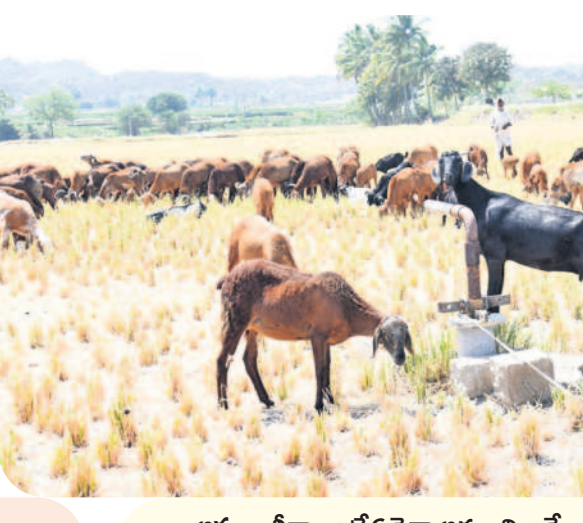
అప్పులు తీర్చాలంటే ఏదైనా అమ్మాలిందే..

నేను ఓ పెద్ద రైతు వద్ద రెండేకరాల పొలం కొలుకు తీసుకున్నా. ఆ పొలంలో సుమారు యాభై వేల అప్పు చేసి వరి వేశా. పొలం దున్నినప్పటి నుంచి నాట్లు, ఎరువులు వంటి వాటికి యాభై నుంచి అరవై వేల వరకు ఖర్చయింది. నాట్లు వేసి నెల రోజులు కాకముందే బోరు ఎండిపోయింది. దీంతో వరి పూర్తిగా ఎండిపోయింది. నేను నా కుటుంబం మొత్తం పొలం పనుల్లోనే ఉండి పనిచేశా. మేము చేసిన కష్టం పోయినప్పటికీ అప్పులు తీర్చే మార్గం కనిపించడం లేదు.