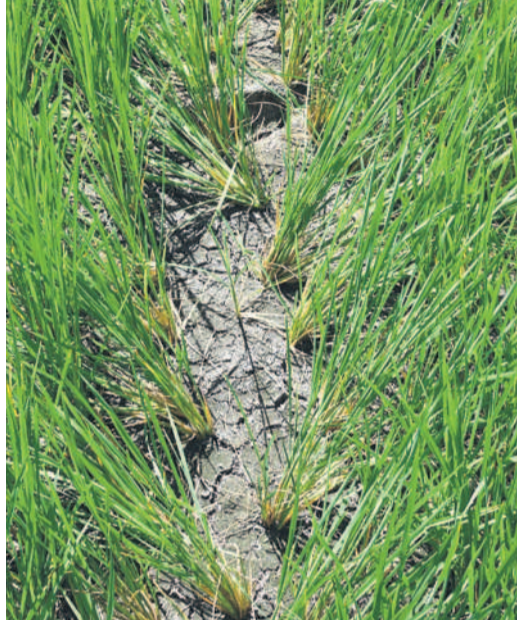
కరీంనగర్ మండలం ముగ్గుంపూర్లో ఎండిపోతున్న వరి పంట.. గత యూసంగిలో కేసీఆర్ ముగ్గుంపూర్ వచ్చినపుడు ఇదే భూమిలో ఎండిపోయిన పంటను పరిశీలించారు. ఇప్పుడు కూడా ఎండి పోతున్నది

కరీంనగర్, మార్చి 6 (నమస్తే తెలంగాణ): పండేల్లో జీవధారగా ఉన్న ఇరుకుల్ల వాగు ఎండిపోయింది. రాష్ట్రం, రిప్పలు, ఇసుక తవ్వక మళ్లీ నీరు కనిపించడం లేదు. ఏడాదిన్నర కిందటి వరకు జీవధారగా పారిన వాగు ఒక్క సారిగా వట్టి పోయింది. వాగును నమ్ముకుని సాగు చేసిన పంటలు ఎండిపోతున్నాయి. నారాయణపూర్ రిజర్వాయర్ నుంచి నీళ్లు రాక పోవడంతోనే ఈ పరిస్థితి ఏర్పడిందని రైతులు వాపోతున్నారు. అధికారులు, నాయకుల చుట్టూ తిరిగినా ఎవరూ పట్టించుకోవడం లేదని ఆవేదన వ్యక్తంచేస్తున్నారు. ఇప్పటికే కొన్ని పంటలు ఎండిపోగా ఇంకొన్ని పంటలు రక్షించుకునేందుకు రైతులు తీవ్రంగా శ్రమిస్తున్నారు. బావుల అడుగులు తవ్వించు కుంటున్నారు. కొత్త బోర్లు వేయించుకుంటు న్నారు. అయినా పంటలను రక్షించుకునే మార్గం కనిపించడం లేదని దిగులు పడుతు న్నారు. వాగులోకి తక్కువే నీళ్లు వదిలితేనే పంటలు చేతికి వస్తాయని వేడుకుంటున్నారు.