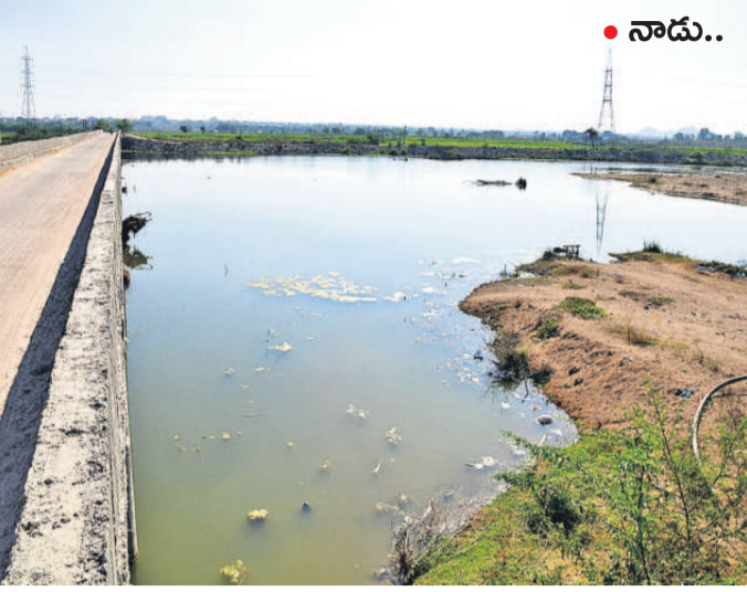
కరీంనగర్ మండలం ఇరుకుల్ల వాగుపై నగునూర్ వద్ద ఉన్న చెక్ డ్యాంలో గతంలో ఉన్న నీళ్లు

-వర్ష పోతన్న రైతు, పుస్తూర్, లోకేశ్వరం మండలం