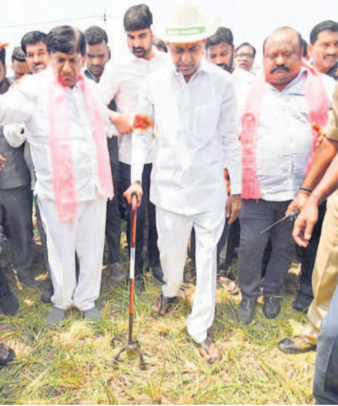
కరీంనగర్ మండలం ముగ్గుంపూర్లో ఎండిపోతున్న వరి పంట.. గత యూసంగిలో కేసీఆర్ ముగ్గుంపూర్ వచ్చినపుడు ఇదే భూమిలో ఎండిపోయిన పంటను పరిశీలించారు. ఇప్పుడు కూడా ఎండి పోతున్నది