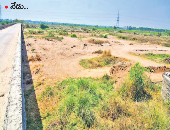
ఇమ్మడు ఇవే చెక్ డ్యాంలో మళ్లీ నీళ్లులేని పరిస్థితి