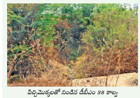
పిచ్చి మొక్కలతో నిండిన డిజీఎం 38 కాల్వ

కేసీఆర్ పాలనే బాగుండే. ఎన్నడూ నీటి కష్టాలు రావు. మండి ఎండల్లోనూ మానేరు నిండు కుండలా ప్రవహించింది. బావులు, బోర్లలో నీళ్లు పుష్కలంగా ఉండేవి. నాకున్న మూడేకరాల భూమి ఎన్నడూ ఎండిపోలేదు. ఇప్పుడు బావిలో నీళ్లు అడుగుంటిపోయాయి. మూడేకరల్లో పరి సాగుచేస్తే సగుం పంటకు నీళ్లు అందుతలేవు. మోటర్ గంట పాటు నడిస్తే బావిలో నీళ్లు అయిపోతున్నాయి. రెండేకరాల పంటను వదిలేయాల్సి వస్తుండేమో. ఇటీవల బావిలో రూ. 80 వేలు పెట్టి పూడిక తీయించినా ఫలితం లేదు. బీఆర్ఎస్ ప్రభుత్వం ఉన్నప్పుడు డిజీఎం 38 కాల్వ ద్వారా నీళ్లు వచ్చినాయే. ఇప్పుడు చెత్తాచెదారం, పిచ్చి మొక్కలతో నిండిపోయింది. అధికారులు నీళ్లు వదిలివచ్చే అవకాశం లేదు. ఈ కాల్వ చివరి ఆయురక్టు మాడే. కాళ్ల శ్వరం ప్రాజెక్టు విలువ మాకు ఇప్పుడు తెలిసి వస్తున్నది.