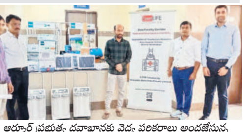
ఆర్మూర్ ప్రభుత్వ దవాఖానకు వైద్య పరికరాలు అందజేస్తున్న . సేవ్ లైఫ్ ఫౌందేషన్ సభ్యులు

వీటిని అందజేసినట్లు తెలిపారు. వీటి సహకా మెరుగైన వైద్యం అందేవరకు ప్రాణాపాయం నుంచి కాపాడవచ్చని అన్నారు. ఈ సంస్థ జాతీయ రహదారికి సమీపంలో ఉన్న దవా ఖానలను ఎంచుకొని సుమారు రూ.15 లక్షల విలువైన అత్యవసర వైద్య పరికరాలను