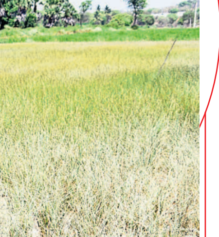
తిప్పాయిగూడలో పొలంలో ఎండిపోయిన వరిపంట

మాకు భూమే ముఖ్యం రేవంత్ సర్కార్ ఎన్ని కేసులు పెట్టినా పోరాటాన్ని మాత్రం ఆపే ప్రసక్తి లేదు. మల్టీపర్చస్ ఇండస్ట్రియల్ పార్కు ఏర్పాటుకు భూములు ఇచ్చేది లేదు. ఉన్న భూమిని సర్కార్ కు ఇచ్చే నేను, నా పిల్లలతో కలిసి ఇతర ప్రాంతాలకు వలస వెళ్తా లా..? లేక భిక్షం ఎత్తుకోవాలా..? ప్రభుత్వం ఇచ్చే పరిహారం మాకు వద్దే.. చట్ట.. దాని కంటే నాకు భూమే ముఖ్యం.