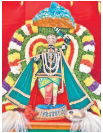
గోవర్ధనగిరిధారి అలంకారంలో లక్ష్మీనరసింహస్వామి