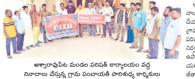
ఆస్కారావుపేట మండల పరిషత్ కార్యాలయం వద్ద నివాదాలు చేస్తున్న గ్రామ పంచాయతీ పాలిటోషి కర్మితులు