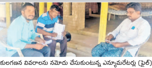
కులగణన వివరాలను నమోదు చేసుకుంటున్న ఎన్నోమరేటర్లు (ఫైల్)