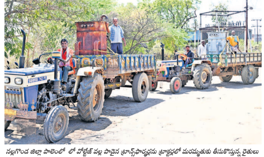
నల్లగొండ జిల్లా పాలెంలో లో వోల్టేజీ వల్ల పాడైన ట్రాన్స్ ఫార్మర్లను ట్రాక్టర్లలో మరమ్మత్తుకు తీసుకొస్తున్న రైతులు