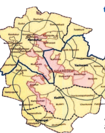
ప్రతిపాదిత పూర్వ సీఎం విస్తీర్ణం

అమనగల్లు మండలాల్లో సేకరించాలనే యోచనలో ప్రభుత్వం ఉన్నది. పూర్వ సీఎం 815 చదరపు కిలోమీటర్ల పరిధిలో నిర్మించేందుకు ప్రభుత్వం ఏర్పాటు చేస్తున్నది. ఇబ్రహీంపట్నం, అమనగల్లు, కడ్రాల్, కందుకూరు, మహేశ్వరం, మంచాల, యాచారం మండలాల పరిధిలోని 30 వేల ఎకరాల్లో సుమారు 815 చదరపు కిలోమీటర్ల విస్తీర్ణంలో ఈ నిర్మాణం చేపట్టాలని నిర్ణయించింది. ఏడు మండలాల్లోని 56 రెవెన్యూ గ్రామాలు 74 గ్రామాలు పరిధిలో ఈ పూర్వ సీఎం విస్తీర్ణం చేపట్టాలని అధికారులు ప్రణాళికలు సిద్ధం చేశారు. ఇప్పటికే యాచారం మండలం మేడపల్లి, నానకొండ, తాటిపల్లి, కుర్తిపర్తి గ్రామాలతోపాటు కందుకూరు మండలం అంజులపేట, ముప్పర్తి, వంజా గూడ, మీరభాసేపేట, తదితర గ్రామాల్లో 14 వేల ఎకరాల భూములను సేకరించారు.