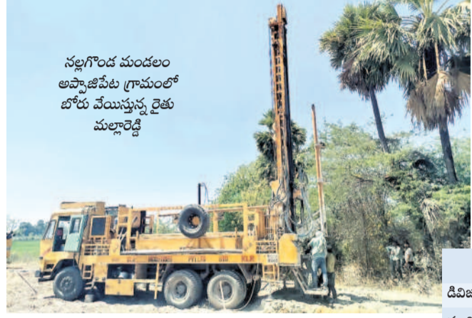
నల్లగొండ మండలం అవాజ్ పేట గ్రామంలో బోరు వేయిస్తున్న రైతు మల్లాజిడి

జిల్లా సగటు 7.74 మీటర్ల దిగువన భూగర్భజలం అత్యధికంగా నాంపల్లి, డిండిల్లో పడిపోయిన నీటిమట్టాలు మున్ముందు మరింత అడుగుంటే ప్రమాదం బోర్లుమీద బోర్లు వేస్తున్న రైతులు పంటలు కాపాడుకునేందుకు భగిరథ ప్రయత్నాలు