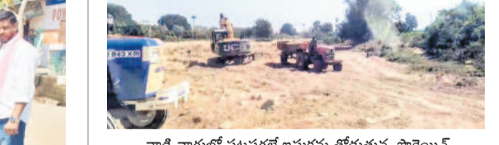
వాడి వారల్లో పట్టణంలో ఇసుకను తోచుకున్న పాశ్చాత్యులు