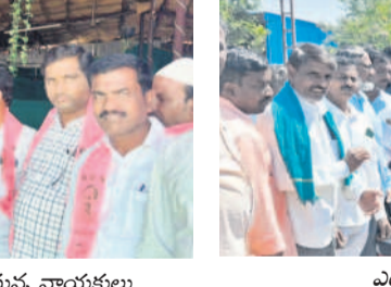
ఎడమల్లో కేక కట్ చేస్తున్న బీఆర్ఎస్ శ్రేణులు