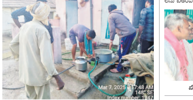
నల్లాలకు బిగించిన మోటార్లు తొలగిస్తున్న జి.పీ.సి.బి.బి.