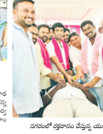
నగరంలో రక్షణం చేస్తున్న యువకులు