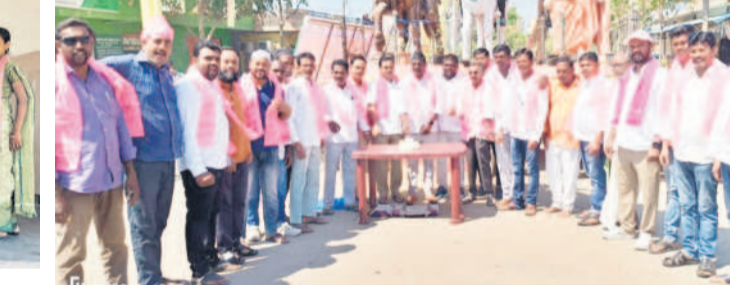
మాక్లూర్లో కేకే కట్ చేస్తున్న బీఆర్ఎస్ నాయకులు

నమస్తే తెలంగాణ యంత్రాంగం, మార్చి 7: బీఆర్ఎస్ నిజామాబాద్ జిల్లా అధ్యక్షుడు, ఆర్కాడ్ మాజీ ఎమ్మెల్యే జీవన్ రెడ్డితోపాటు బోధన్ మాజీ ఎమ్మెల్యే షరీఫ్ అమీర్ అహ్మద్ పుట్టిన రోజు సందర్భంగా శుక్రవారం జిల్లాలోని పలుచోట్ల పార్టీ నాయకులు కేక కట్ చేసి పంపిణీ చేశారు. జిల్లా కేంద్రంలోని ఎల్లమ్మ గుట్ట బీఆర్ఎస్ కార్యాలయంలో కేక కట్ చేసి పుట్టిన రోజు వేడుకలను నిర్వహించారు. ఆనంతరం మొక్క నాలూరు, పట్టణ యువకుల రక్షణం చేసే కేక కట్ చేసి సంబురాలు నిర్వహించారు. బోధన్లో మాజీ ఎమ్మెల్యే మహ్మద్ షరీఫ్ జన్మదినం సందర్భంగా బీఆర్ఎస్ యువ నాయకులు భోజనం, పండ్లు, స్వీట్స్, వాల్ట్ బాల్లెట్లను అందించారు. ఎడమల్లోని మంగళవాయి చౌరస్తాలో బీఆర్ఎస్ నాయకులు కేక కట్ చేసి పంపిణీ చేశారు. బోధన్ మండలంలోని ఆచనపల్లి శివారులో షరీఫ్ జన్మదిన వేడుకలను బీఆర్ఎస్ నాయకులు నిర్వహించారు. ఆర్కాడ్ మాజీ