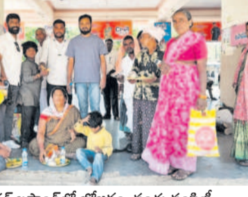
బోధన్ బస్టాండ్లో బోజనం, పండ్లు పంచుతూ చేస్తున్న బీఆర్ఎస్ యువ నాయకులు