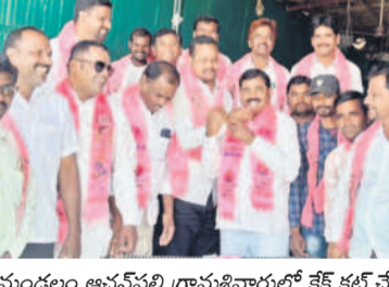
బోధన్ మండలం ఆచనపల్లి గ్రామశివారులో కేక కట్ చేస్తున్న నాయకులు