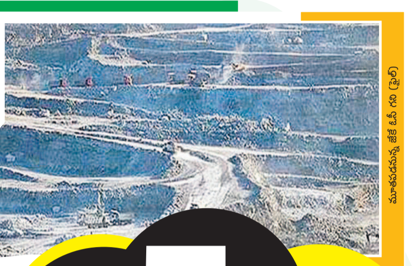
మూతపడనున్న జేకే 5 ఓసీ గని (ఫైల్)

ఆసిముత్సంగాంటి జేకే 5 ఓసీ గని ఈ ఉగాదికి మూతపడనుంది. బొగ్గు నిక్షేపాలు అయిపోవడంతో గనిని మూసివేసేందుకు సింగరేణి యాజమాన్యం సమావేశమైంది. దీంతో బొగ్గుకు పుట్టినిల్లు అయిన బొగ్గుపల్లి (ఇల్లెండు) చీకటిమయంకానుంది. దేశానికి బొగ్గును మొట్టమొదటిసారిగా పరిశ్రమం చేసిన ఇల్లెండు పీరు కనుమరుగయ్యే వల్ల నిక్షేపాలు కనిపిస్తున్నాయి. ఎంతోమందికి భవిష్యత్తుతోపాటు దేశానికి వెలుగులు నింపిన బొగ్గుపల్లి నేడు అందకారం లోకి వెళ్ళనున్నది. ఇల్లెండు ఏరియలో పరోక్షంగా జీవనోపాధి పొందుతున్న వ్యాపార, వాణిజ్యవర్గాలు సైతం అందోళనలో ఉన్నారు. ఒక్కొక్కటిగా ఇల్లెండులో ఉన్న గనులు మూతపడుతూ చివరిగా మిగిలిన జేకే 5 ఓసీ కూడా మూసివేత దిశగా ఉండడంతో ఇక్కడి ప్రజలు జీవనోపాధి కోసం వెలసలు వెళ్ళేందుకు సిద్ధమవుతున్నారు. - ఇల్లెండు రూరల్, మార్చి 8