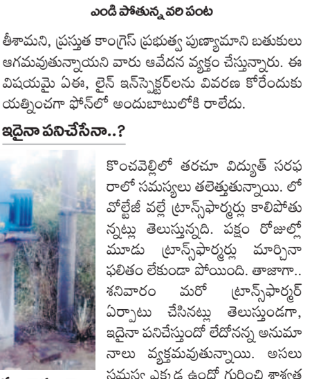
సాంకేతిక సమస్యల కారణంగా పాడైపోయిన ట్రాన్స్ ఫార్మర్ (ఫైల్)

యూసంగిలో కొంచెంవెల్లి రైతులు బోర్లపై ఆధారపడి వరి సాగు చేశారు. కరెంట్ సరఫరాకు సంబంధించి ఎప్పటికప్పుడు మరమ్మతులు చేపట్టకపోవడంతో తరచూ సమస్యలు ఎదురవుతున్నాయి. ఈ క్రమంలో గత నెల 23న కెనాల్ ఏరియా లోని విద్యుత్ ట్రాన్స్ ఫార్మర్ ప్యాజిపోయింది. 'పంటలు ఎండిపోతున్నాయి.. జర పట్టించుకోండి సార్' అంటూ రైతులు అధికారుల చుట్టూ ప్రదక్షిణలు చేసి మొరటట్టుకోగా, ఈ నెల 3న కొత్త ట్రాన్స్ ఫార్మర్ ను అమ్మారు. అది ఆన్ చేయగానే కాలిపోయింది. ఈ నెల 7 (శుక్రవారం)న మరో ట్రాన్స్ ఫార్మర్ ను ఏర్పాటు చేసి ఆన్ చేయగా, అది కూడా కాలిపోయింది. సాంకేతిక లోపాల కారణంగా తరచూ ట్రాన్స్ ఫార్మర్లు కాలిపోతుండగా, సుమారు 40 ఎకరాలలో వేసిన వరి చేతికందకుండా పోయే పరిస్థితి వచ్చింది. ఇప్పటికే చాలా వరకు పంట ఎండిపోగా, దిగువపై ప్రభావం చూపే అవకాశమున్నది. కేసీఆర్ సర్కారులో 24 గంటల కరెంట్ రంది లేకుండా పంటలు