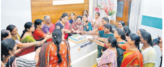
కేకే కేసీ వేడుకలు ఇస్తుంటున్న మహిళలు