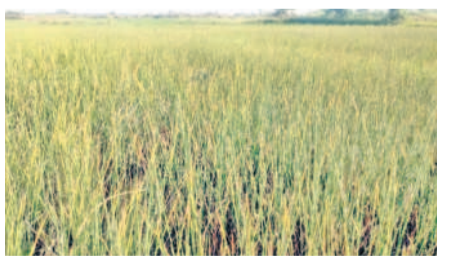
ఎండిపోతున్న వరి పంట

దహాగం, మార్చి 8 : మండలంలోని కొంచెంవెల్లిలో తరచూ ట్రాన్స్ ఫార్మర్లు కాలిపోతుండగా, పొట్లకొచ్చే దశలో సన్న పంటలు ఎండిపోతున్నాయి. పక్షం రోజుల్లో మూడు ట్రాన్స్ ఫార్మర్లు మార్పిడి ఫలితం లేకపోగా, కష్టనష్టాలకోర్కె వేసిన వరి చేతికందకుండా పోయే పరిస్థితులు దాపురించాయి. తాజాగా.. మరో ట్రాన్స్ ఫార్మర్ అమ్మినట్లు తెలుస్తుండగా, లో వోల్టేజీ సమస్య వల్ల ఇద్దెనా పనిచేస్తున్నా.. లేదా అన్న అనుమానాలు వ్యక్తమవుతున్నాయి.